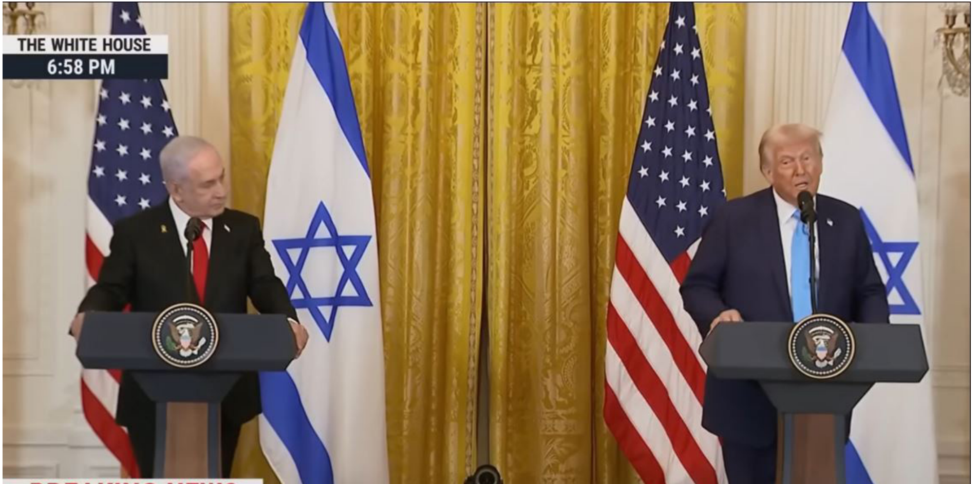
ימינה מנתניהו, ראש הממשלה ונשיא ארה"ב השבוע