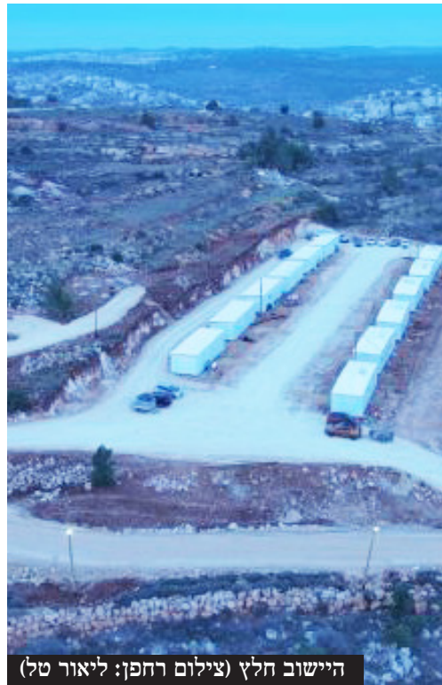
היישוב חלץ (צילום רחפן: ליאור טל)

לירושלים. השבוע, לפני 77 שנים, יצאה לדרך לוחמי שיירת הל"ה בדרכם לגוש עציון המבודד, ונהרגו בקרב קשה בין הרי חברון. היום סגרנו מעגל ופרענו חוב מוסרי למייסדי גוש עציון ומגיניו ולחללי שיירת הל"ה.