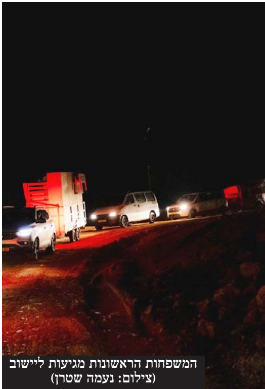
המשפחות הראשונות מגיעות ליישוב