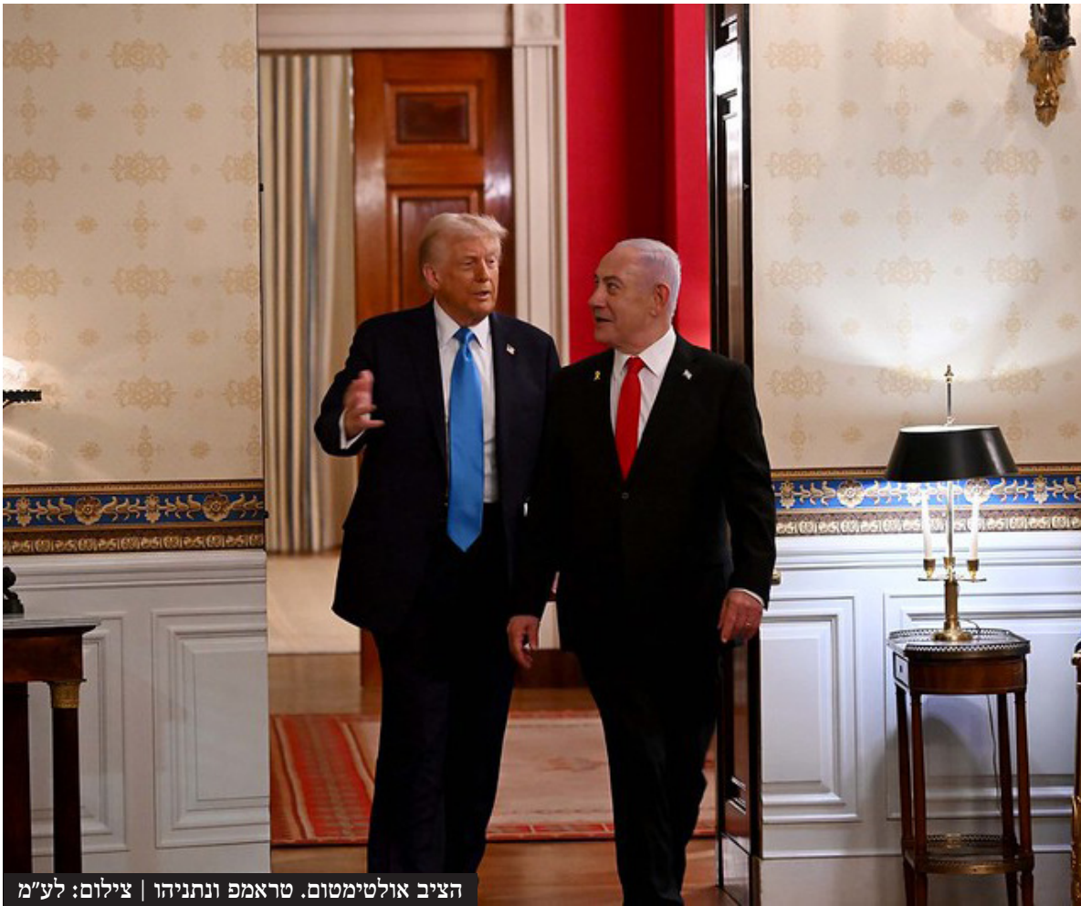
הציב אולטימטום. טראמפ ונתניהו

דובר הזרוע הצבאית של חמאס, אבו עובידה, טען כי הסיבות המרכזיות הן עיכוב בחזרתם של העקורים לצפון רצועת עזה, ירי באזורים שונים ברצועה ואי אספקת ציוד הסיוע ההומניטרי עליו סוכם. בעקבות זאת, אבו עובידה הודיע כי העברת החטופים הישראלים שהייתה אמורה להתבצע בשבת, תידחה "עד להודעה חדשה ועד שישראל