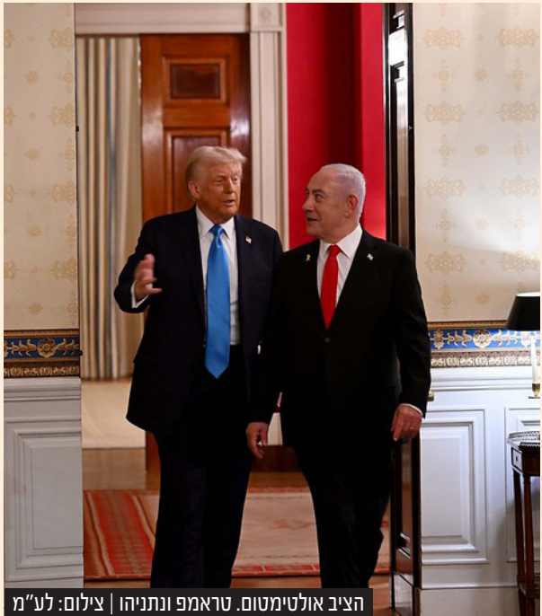
הציב אולטימטום. טראמפ ונתניהו