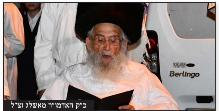
כ"ק האדמו"ר מאשג זצ"ל