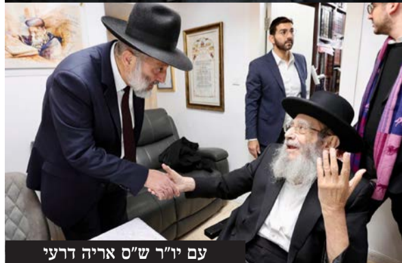
עם יו"ר ש"ס אריה דרעי