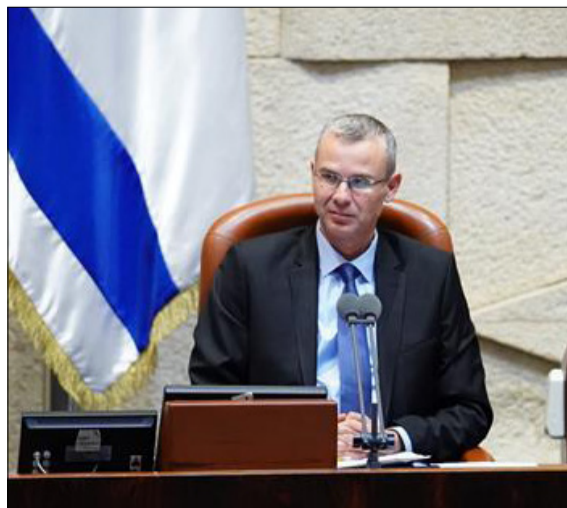
« ישרים את הדחת מיארה? שר המשפטים יריב לוין »

מעדויות של נוכחים במקום, זו הייתה פגישה ארוכה בהרבה מהרגיל בין שני ראשי הסייעות, כולל שיחת עומק לבבית, שכבר הניחה את היסודות למהלך המשותף על התקציב, ולהודעה שנועדה לבשר לסייעה המרכזית באופן רשמי שהיא מבודדת, ואם תנקוט בצעד מחאתי, היא תצטרך לעשות זאת לבד. יודעי דבר מספרים שהיה מי שהציע לצרף לתמונה עדכנית גם את הנציגים האגודאים שחברו לציר, קרי השר פרוש וח"כ אייכלר, אבל מתוך רצון שלא לסובב את הסכין, העדיפו בש"ס ובדגל התורה לוותר. גם כך, מי שהיה צריך להבין את מקומו, הבין.