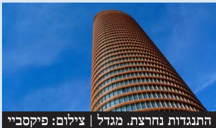
התנגדות נחרצת. מגדל

התוכנית ממתינה להחלטה סופית של הוועדה המחוזית, שתצטרך לשקול את עמדות הצדדים השונים