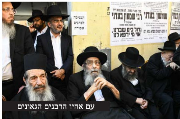
עם אחיו הרבנים הגאונים