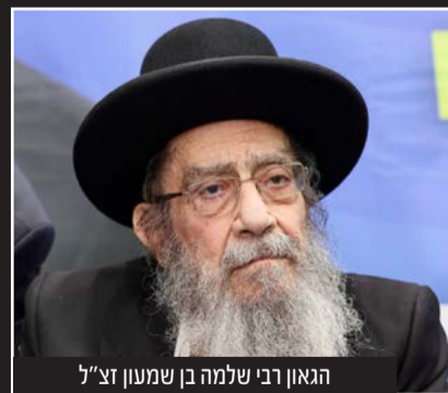
הגאון רבי שלמה בן שמעון זצ"ל