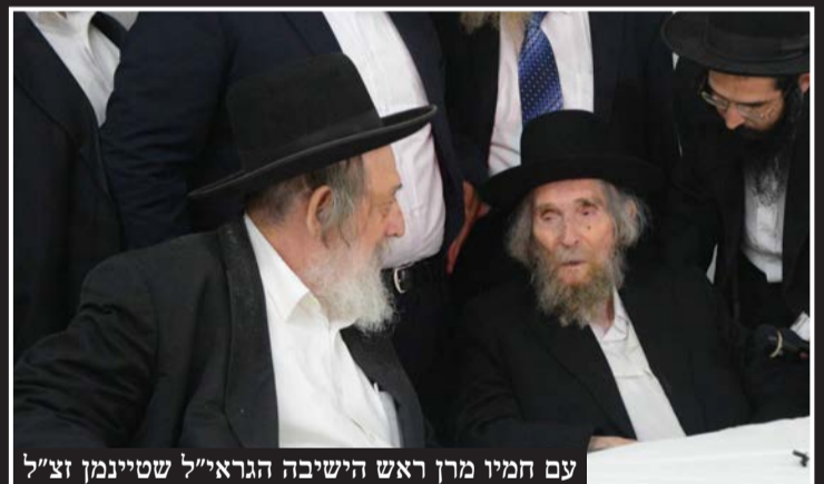
עם חמיו מרן ראש הישיבה הגרא"ל שטיינמן זצ"ל