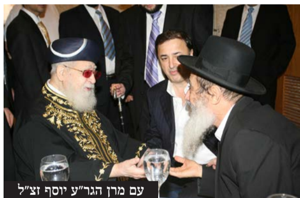
עם מרן הגר"ע יוסף זצ"ל