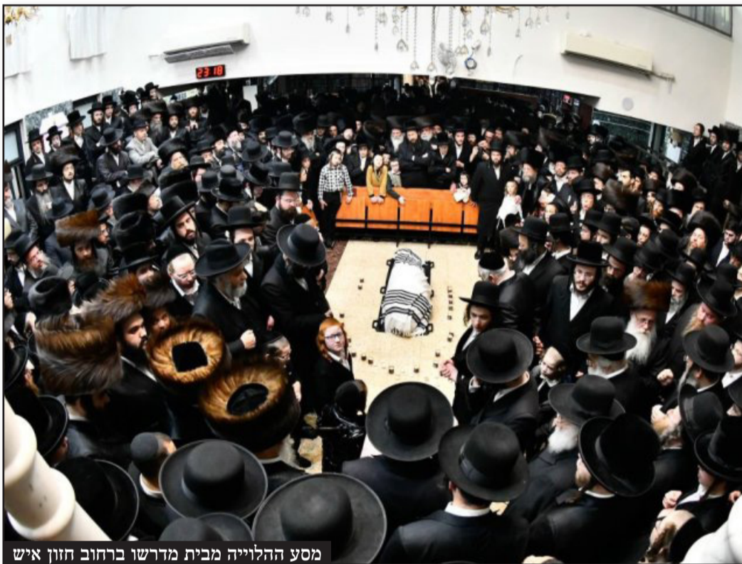
מסע ההלווייה מבית מדרשו ברחוב חזון איש