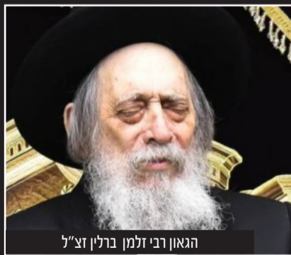
הגאון רבי זלמן ברלין זצ"ל