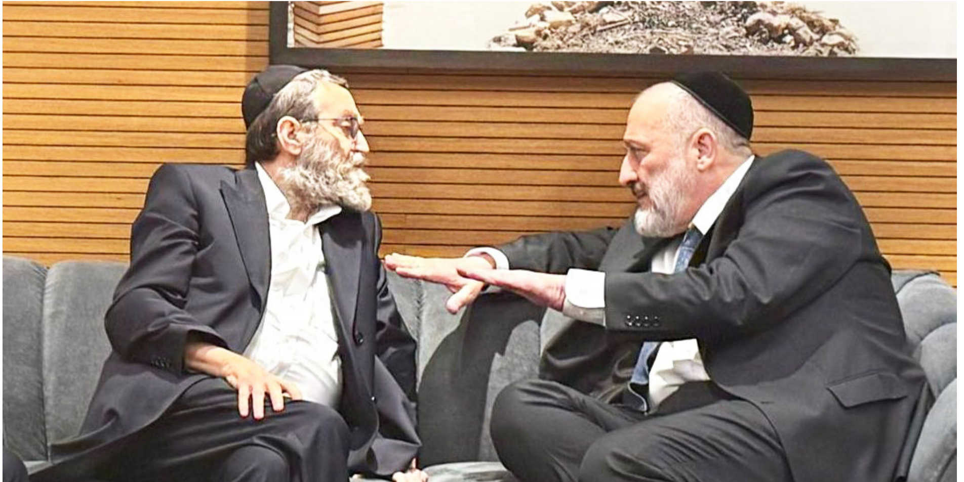
שבת אחים. גפני ודרעי בפגישה ממושכת ב'פרסה'

מצד אחד, יש מי שמעדיף למסמס את העיסוק בחוק בתקופה הרגישה הזו ולהמתין עוד מעט, והוא זוכה בשבוע האחרון גם לתמיכה מפתיעה מראשי המפלגות החרדיות, שמוכנים לקבל את האפשרות שהחוק ימתין לכנס הקיץ של הכנסת, ויטופל מיד בתחילתו, לכל היותר עד חג השבועות הבעל"ט. מצד שני, יש מי שלוחץ ומתעקש לקדם את החוק - אם לא לפני התקציב, לכל הפחות בצמוד לו ממש, ולהצליח להביא אותו למליאת הכנסת כבר בכנס החורף הנוכחי