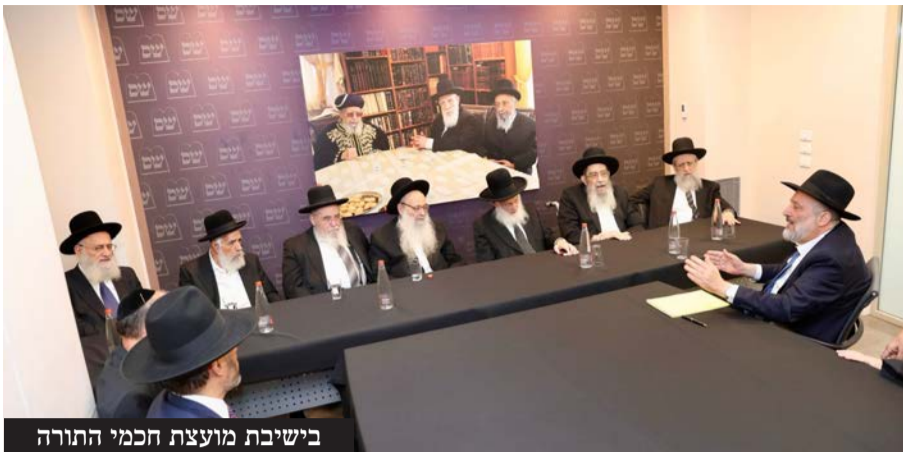
בישיבת מועצת חכמי התורה

רבות בפסיקותיו ובהלכותיו. בבתי הדין בהם שימש כדיין ומוראה הוראה ידעו הכל, כמה היה בקי בכל חדרי תורה, הרביץ תורה והלכה בכל אתר ואתר, ובמסירותו העצומה למסורת אבותיו הדגולים, העמיד הדת על תילה בהיותו שומר משמרת הקודש, והיה מדמויות ההוד וההדר שתרמו רבות לצבינה ודמותה של עולם הדיינות והרבנות. יראתו שקדמה לחכמתו היתה לשם דבר, בהיותו ירא שמים מרבים, שהיה בקי גדול בחכמת הקבלה, וערך פדיונות נפש, וקיבל רבים לעצה ותושיה בכל מכמני ההלכה וההוראה.