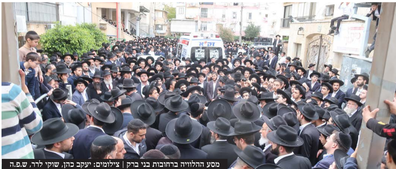
מסע ההלוויה ברחובות בני ברק | צילומים: יעקב כהן, שוקי לרר, ש.פ.ה

עולם התורה איבד את גאב"ד 'נווה ציון', הגר"ש בן שמעון זצ"ל בעל ה'דברי שלמה' וחבר מועצת חכמי התורה שהשיב נשמתו ליוצרו בגיל 88, והותיר חלל עצום בקרב תלמידיו והציבור הרחב שראה בו עמוד תווך של עולם הפסיקה בדורנו