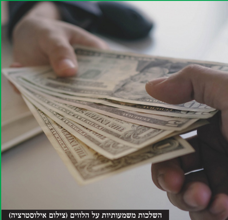
השלכות משמעותיות על הלווים (צילום אילוסטריציה)