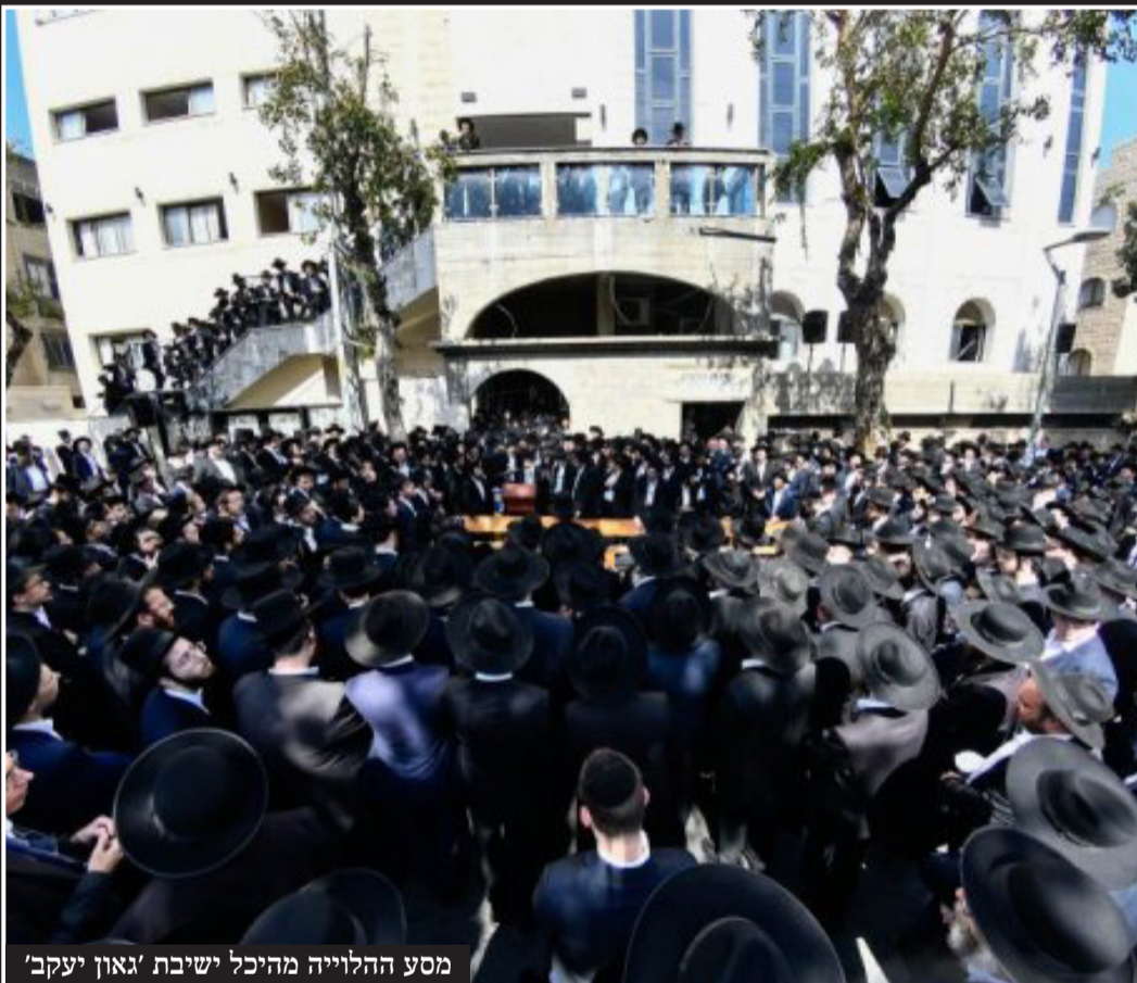
מסע ההלוויה מהיכל ישיבת 'גאון יעקב'