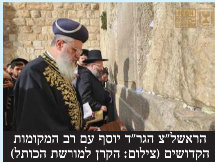
הראש"צ הגר"ד יוסף עם רב המקומות הקדושים

בבית הנשיא, בקריה בתל אביב, במוזיאון ישראל ובמחסני רשות העתיקות לגניזה במקומן לצד אבני הכותל. בתגובה לכך, השר עמיחי שיקלי השיב בשם הממשלה ובשם מ"מ שר המורשת, השר חיים כץ, כי המדינה תפעל בהתאם להחלטת הרבנות הראשית. בהתאם לכך, הודיעו הראשון לציון והרב הראשי לישראל הגאון רבי דוד יוסף שליט"א ורב הכותל המערבי והמקומות הקדושים הגאון רבי שמואל רבינוביץ שליט"א, במכתב רשמי על עמדת ההלכה ועמדת הרבנות הראשית לישראל לדורותיה, ועל פיו אבנים אלו קודש הן ואין לנו רשות להשתמש בהן, והן צריכות גניזה. מקום גניזתן הוא בצד האבנים שנפלו מהר הבית, המונחות בערמה בצד הדרומי של הכותל המערבי.