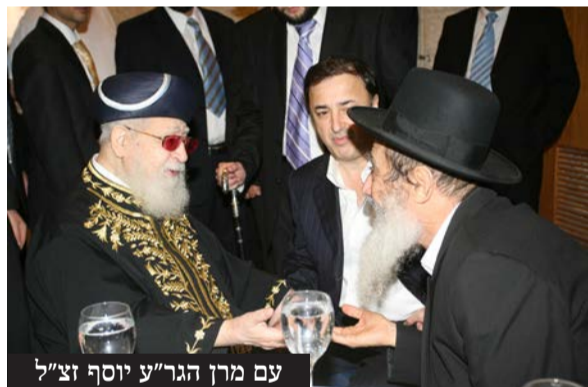
עם מרן הגר"ע יוסף זצ"ל