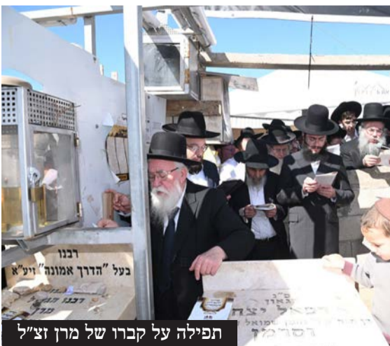
תפילה על קברו של מרן זצ"ל