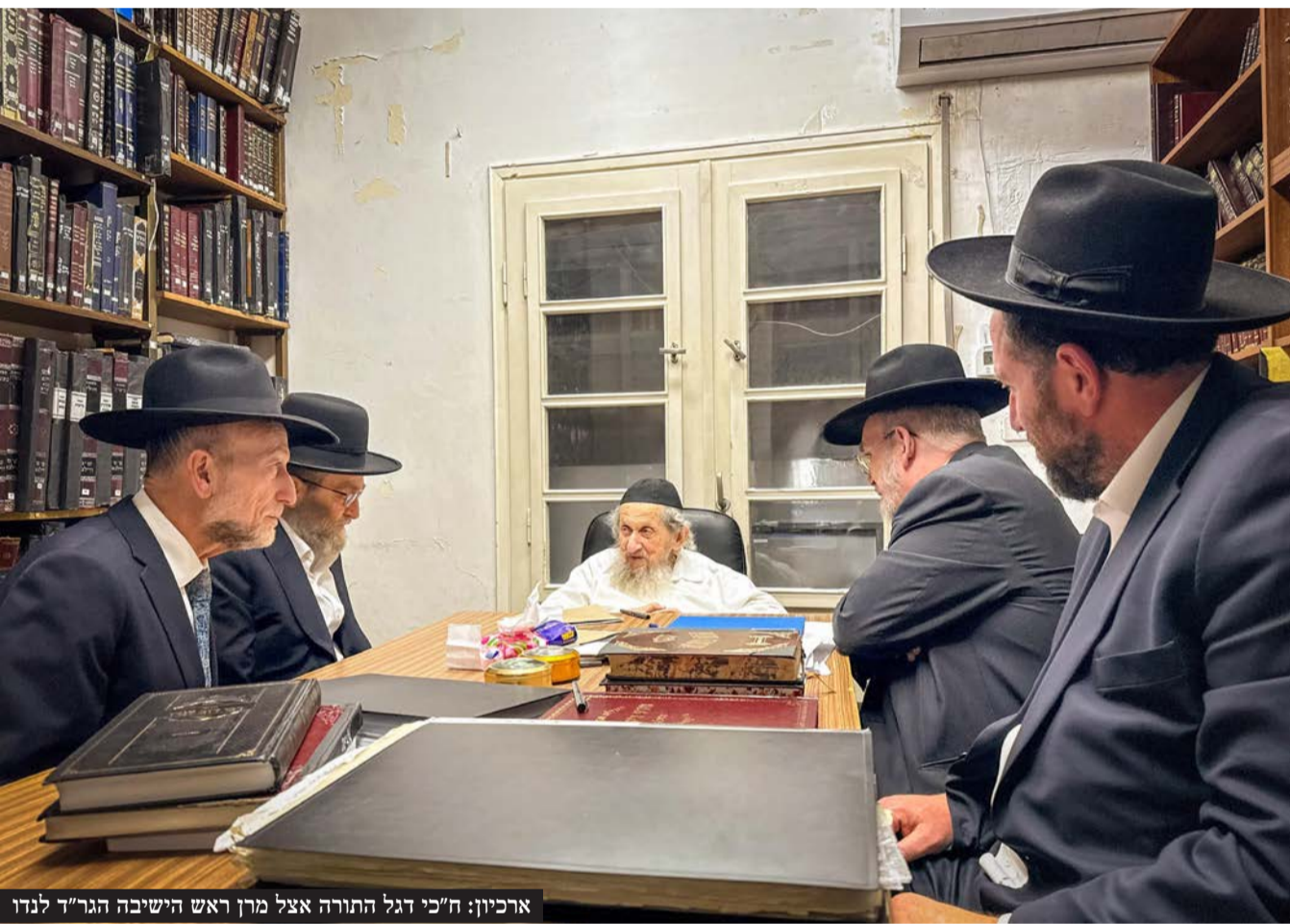
ארכיון: ח"כ דגל התורה אצל מרן ראש הישיבה הגר"ד לנדו

מרן רה"י לנציגי דגל התורה: "החוק הזה הוא החוק הכי גרוע שיש, הוא לא חוק טוב והוא אף יזיק מאוד לעולם התורה. ומי שטוען שיש ללחוץ על ראש הממשלה להעביר את החוק מיד ועכשיו, הוא טועה" • שלושה מנציגי אגו"י שיגרו מכתב לנתניהו: "בהתאם להוראת רבותינו חברי סיעת אגודת ישראל יתנגדו בהצבעה על אישור התקציב כל עוד לא תוסדר סוגיית מעמדם של בני הישיבות" • בש"ס ובדגל התורה טוענים: הניסיון להציב לרה"מ אולטימטום רק יגרום להחרפת מצבם של בני הישיבות כיוון שלפי החוק המוצע, לפחות חמישים אחוזים מחייבי הגיוס החרדים יהיו חייבים להתגייס