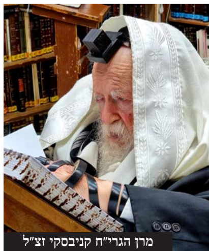
מרן הגרי"ח קניבסקי זצ"ל

זצ"ל. העצרת תיערך בהשתתפות הגאון הצדיק רבי שמעון גלאי שליט"א ובנו של שר התורה, מרן הגאון רבי יצחק שאול קניבסקי שליט"א, שיתפללו יחד עם ההמונים למען עם ישראל.