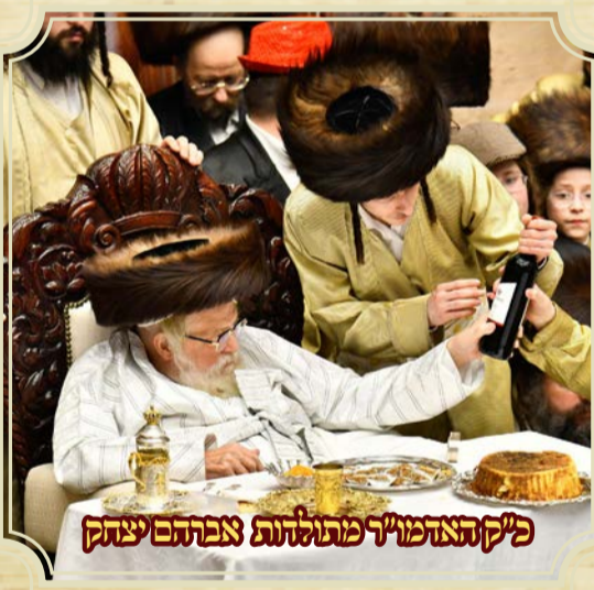
כ"ק האדמו"ר מתולדות צפתהם יצחק