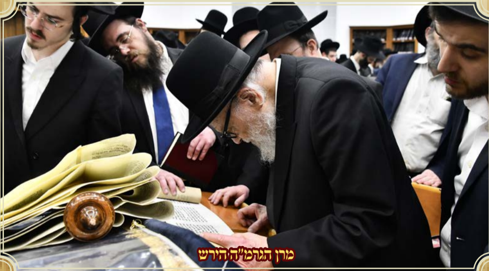
מרחן הגרמ"ה הירש