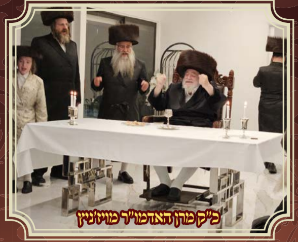
כ"ק מרחן האדמו"ר מוויזניץ