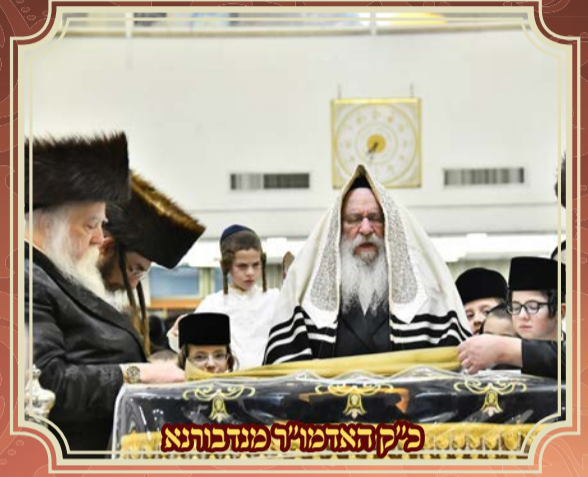
כ"ק האדמו"ר מנדבורנא