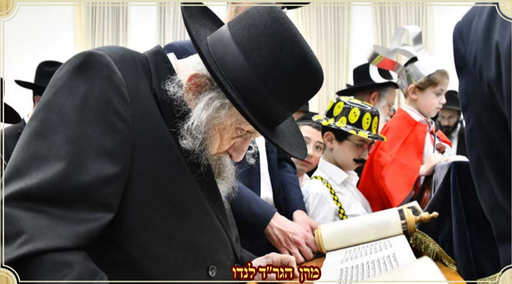
מרחן הגר"ד לגדו