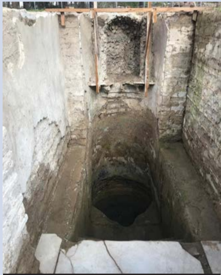
בור המקווה שנחשף