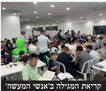
קריאת המגילה ב'אנשי המעשה'

בקהילת אנשי מעשה בכפר גנים התכנסו בני הקהילה לקריאת המגילה ברוב עם ומיד לאחר מכן התקיים במקום הפנינג משפחות לכל בני הקהילה. במקום נפתחו דוכני מזון, דוכני צילום ומוזיקה שמחה. אחד מבני הקהילה סיפר ל'השבוע בפתח תקווה': "אוירת האחדות ששוררת אצלנו בקהילה, היא מדהימה. אני מתגורר רחוק מאוד וצועד כל שבת וחג כי אי אפשר לוותר על האוירה הטובה שקיימת אצלנו".