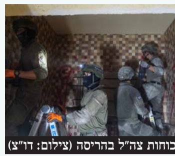
כוחות צה"ל בהריסה

כוחות צה"ל הרסו השבוע בקלקיליה את בית המחבל שביצע את פיגוע הטרור בקלקיליה בו נרצח תושב העיר אמנון מוכתר ז"ל. המחבל ביצע יחד עם מחבלים נוספים, בתאריך 22 ביוני 2024 פיגוע טרור בעיר קלקיליה בו נרצח אמנון ז"ל. בהודעה שפרסם דו"צ נכתב: "כוחות הביטחון ימשיכו לפעול לסיכול טרור ולמיצוי הדין עם כל מחבל שפגע באזרחים ישראלים ובכוחות הביטחון".