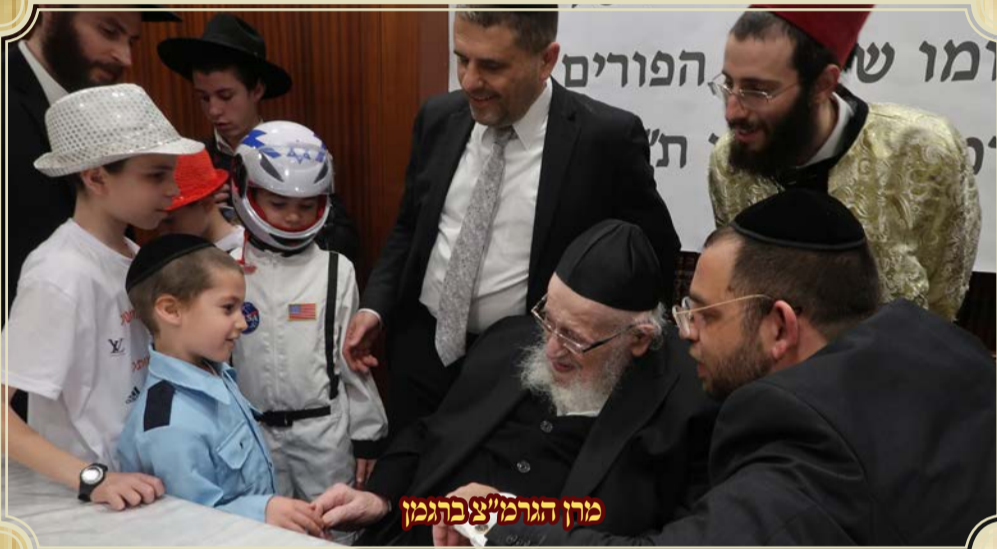
מרחן הגרמ"צ בתל אביב