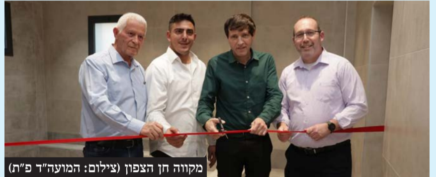
מקווה חן הצפון

המקווה מצטרף לרשימה ארוכה של מקוואות טרה חדישים ומפוארים שנבנו בשנים האחרונות