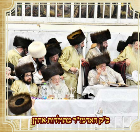
כ"ק האדמו"ר מתולדות צפתן