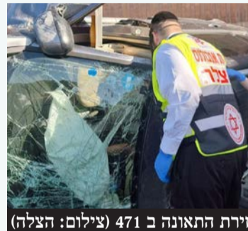
זירת התאונה ב 471