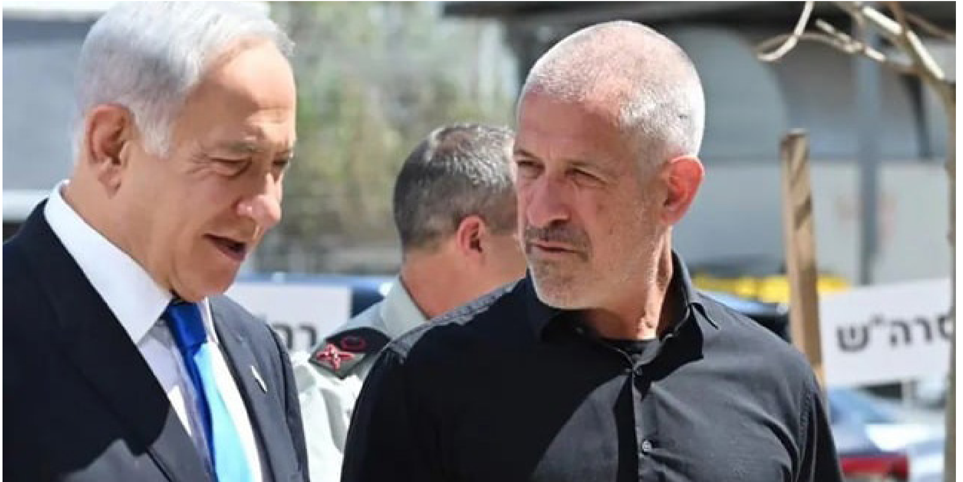
ראש הממשלה וראש השב"כ בימים יפים יותר

שיריונים בליכוד (ה'אם) במקרה הזה הוא לשם הדיוק המשפטי גרידא. קשה לזכור רשימת ליכוד בשנים האחרונות שנתניהו לא קיבל בה כמה שיריונים), הראשון מביניהם יעבור לידי של סער. תיאורטית, סער יכול גם לשריין את עצמו, צעד שהוא ככל הנראה לא יזדקק לו וגם לא מעוניין בו. בפועל, הוא עשוי לשריין את מי שהלך אתו להקמת המפלגה העצמאית, השר זאב אלקין, והוא יכול גם לבחור לשריין מישהו אחר, יהיה זה אחד מחברי הרשימה הנוכחית של הימין הממלכתי או כל מי שימצא לנכון. כך או כך, האירוע בדרך להסתיים. מפלגת הליכוד תגדל לשלושים ושישה מנדטים וקואליציית השישים ושמונה תקבל ייצוב משמעותי, בתקווה שגם 'עוצמה יהודית' תסיים את התנהלות הברוגו התמוהה ותשוב לשורות הממשלה כבר בשבועות ואולי בימים הקרובים.