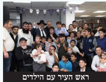
ראש העיר עם הילדים