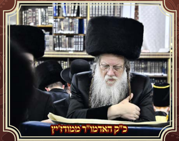
כ"ק האדמו"ר ממודו"ץ