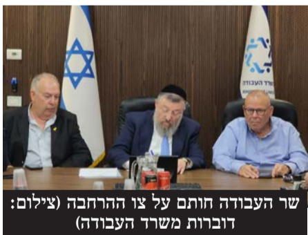
שר העבודה חותם על צו ההרחבה

יקבלו מחצית משווי התו. שווי הסי יתעדכן לפי עליית מדד המחירים לצרכן.