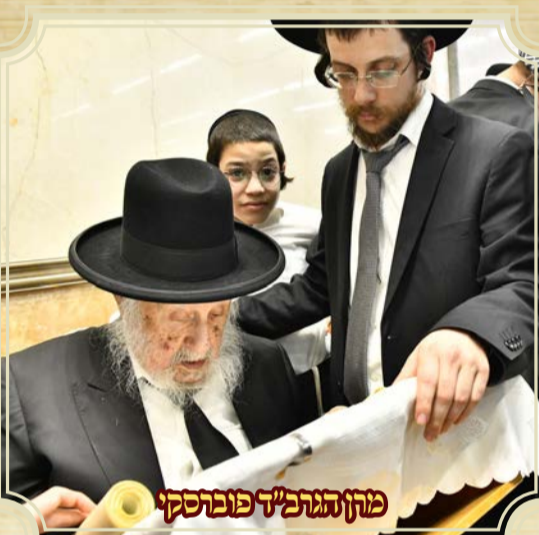
מחן הגרב"ד פוברסקי