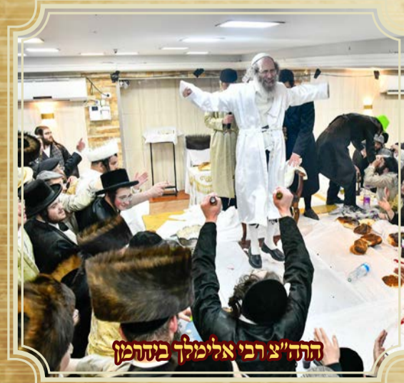
הרה"צ רבי אלימלך ביהמ"ן