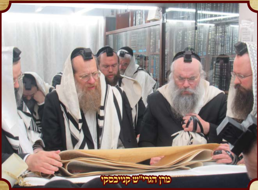
מרן הגרי"ש קנייבסקי