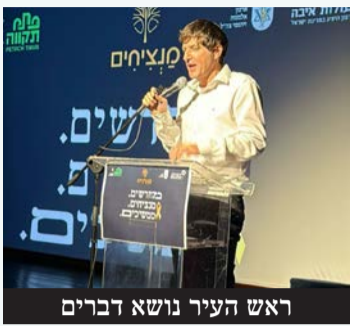
ראש העיר נושא דברים