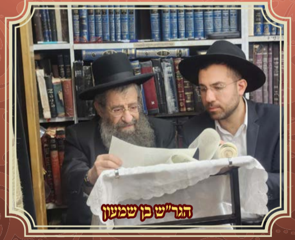
הגר"ש בן שמעון