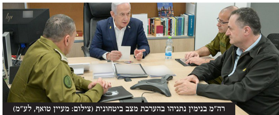
רה"מ בנימין נתניהו בהערכת מצב ביטחונית

צה"ל תקף עשרות מטרות ברצועת עזה וחסל בכירים בארגוני הטרור, חמאס מדווח על מאות הרוגים, והרצועה שוקעת שוב בכאוס. בבית הלבן מגבים את ישראל: "הגיהינום ישתחרר. כל הטרוריסטים במזרח התיכון צריכים לקחת את טראמפ ברצינות" | עמ' 8