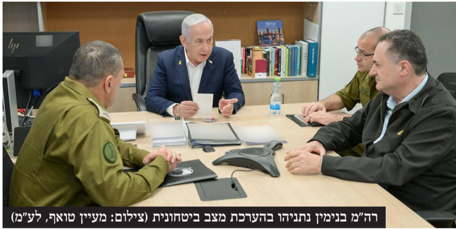
רה"מ בנימין נתניהו בהערכת מצב ביטחונית

הם חלשים מאוד, פיזית ונפשית". צה"ל הוציא הוראת פינוי למספר שכונות בעזה, בהן שכונת בית חאנון ממנה כבר תועדה תנועת עקורים עזתיים. "אזורים אלו נחשבים לאזורי לחימה מסוכנים. למען ביטחונכם, עליכם להתפנות מיד למקלטים המוכרים במערב העיר עזה ובחאן יונס", מסר דובר צה"ל בערבית. השכונות שהוגדרו "אזורי לחימה מסוכנים" הם מרחבים מיושבים הנמצאים סמוך לאזור החיץ החדש בגבול הרצועה, בהם יש גם מוצבים חדשים של צה"ל. בהתאם לכך בצבא הורו להרחיק אוכלוסייה אזרחית מהאזור, מחשש שחמאס ינסה להוציא מתקפה, גם באמצעות מנהרות, בתגובה לתקיפות.