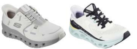
חווית נוחות מדהימה בכל צעד

מותג הספורט Skechers משיק את קולקציית GLIDE STEP - טכנולוגיה פורצת דרך ושילוב מושלם של נוחות וסטייל במגוון רחב של קטגוריות: נעלי ספורט, ריצה, הליכה, נעלי שטח ונעלי סליפ אינס שנועלים בלי ידיים.