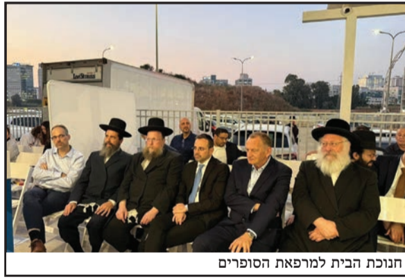
חנוכת הבית למרפאת הסופרים