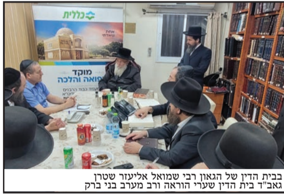
בבית הדין של הגאון רבי שמואל אליעזר שטרן גאב"ד בית הדין 'שערי הוראה' ורב מערב בני ברק