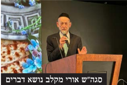
סגה"ש אורי מקלב נושא דברים

בסיום המפגש חילק סגן השר מצות ויין לכל המשתתפים, ונשא דברים נרגשים • במהלך הטקס שהתקיים במוזאון יידי ישראל קם אחד הניצולים, כנציג המשתתפים, ואמר בהתרגשות: "סגה"ש מקלב הוא לא רק נעים הליכות אלא הוא האדם הנכון במקום הנכון הוא הדמות שמקדמת עבורנו את הצרכים שלנו"