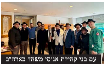
עם בני קהילת אנוסי משהד בארה"ב

מיד עם שובו לישראל, כשבוע לפני חג הפסח, קיים הרב זביחי את מעמד חלוקת קמחא דפסחא במסגרת החלוקה השנתית המתקיימת ע"י מוסדות 'תפארת רפאל' מעל יובל שנים. חלק מהחלוקה בוצעה באמצעות כרטיסי אשראי ותווים לרכישה בחנויות מזון בלבד, וחלק התקיים כפי שנהוג מקדמת דנא באמצעות חלוקה של מצות שמורות, יינות, חרוסת ושאר מצרכי החג.