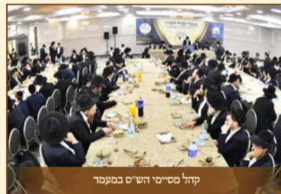
קהל מסיימי הש"ס במעמד