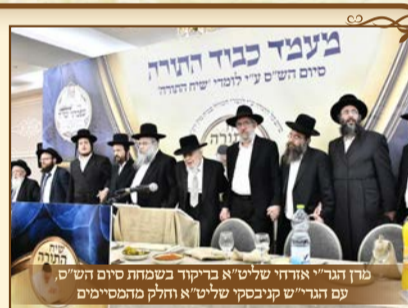
מרן דגרי"א אורחי שליט"א בריקוד בשמחת סיום הש"ס עם הגרי"ש קניבסקי שליט"א וחלק מהמסיימים