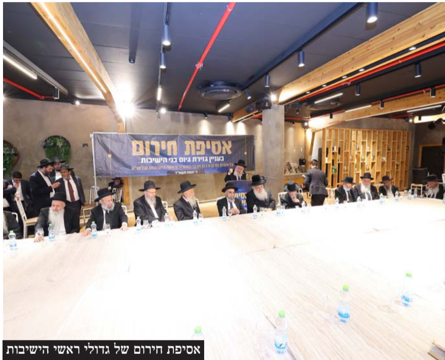
אסיפת חירום של גדולי ראשי הישיבות

ע"פ הנתונים שבידי 'אגודת בני הישיבות', בימים אלו ממש יש כ-3,000 בחורי ישיבות בהגדרת "משתמטים" ותחת סיכון למעצרים • בחודש אייר הקרוב, יצטרפו אליהם עוד 7,000 בני ישיבות, שצווי הגיוס נשלחו אליהם לפני יותר מחצי שנה, בחודש אב תשפ"ד