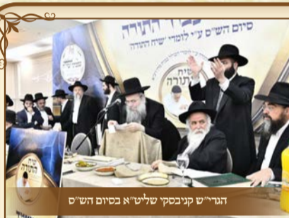
הגרי"ש קניבסקי שליט"א בסיום הש"ס

בני העליה שסיימו ולא הצליחו להשתתף במעמד, יוכלו לקבל את השי שחולק במעמד, בבית מרן זצוק"ל