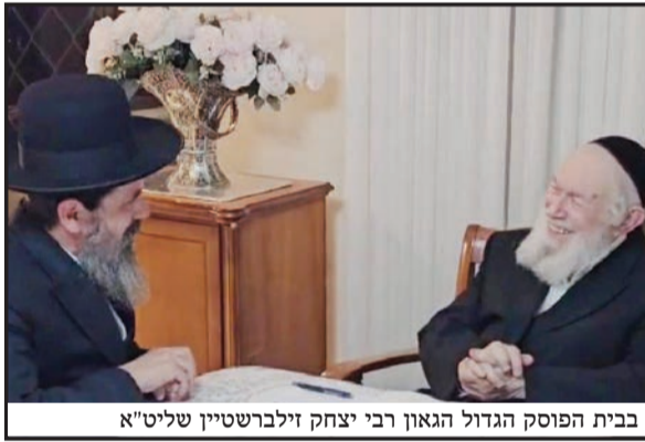
בבית הפוסק הגדול הגאון רבי יצחק זילברשטיין שליט"א