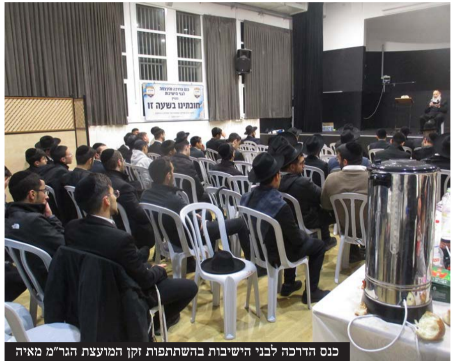
כנס הדרכה לבני הישיבות בהשתתפות זקן המועצת הגר"מ מאיה