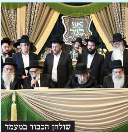
שולחן הכבוד במעמד

מעמד היסטורי לרגל 25 שנה לרשת מוסדות אורחות תורה. במעמד שהתקיים ביום רביעי בראשות גדולי הדור השתתפו מאות ראשי ורבני המוסדות בארץ הממשיכים את מורשתו ודרכו של אבי הישיבה מרן רשכבה"ג הגרא"ל שטיינמן זצוק"ל בהם 'ארחות תורה' בבני ברק,