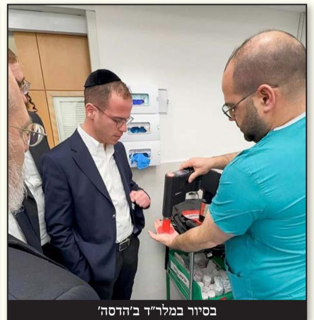
בסיוור במלר"ד ב'הדסה'

"אנחנו משתדלים לפעול בכל מקום שאנחנו יכולים. לא רק מול מטופלים, אלא גם מול מנהיגי ציבור, אנשי חינוך וראשי ישיבות.