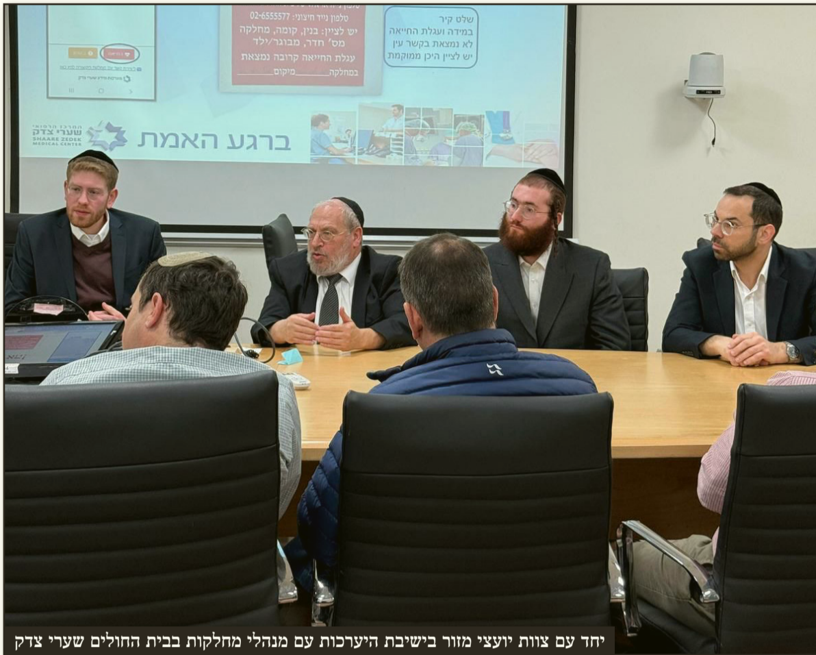
יחד עם צוות יועצי מזור בישיבת היערכות עם מנהלי מחלקות בבית החולים שערי צדק