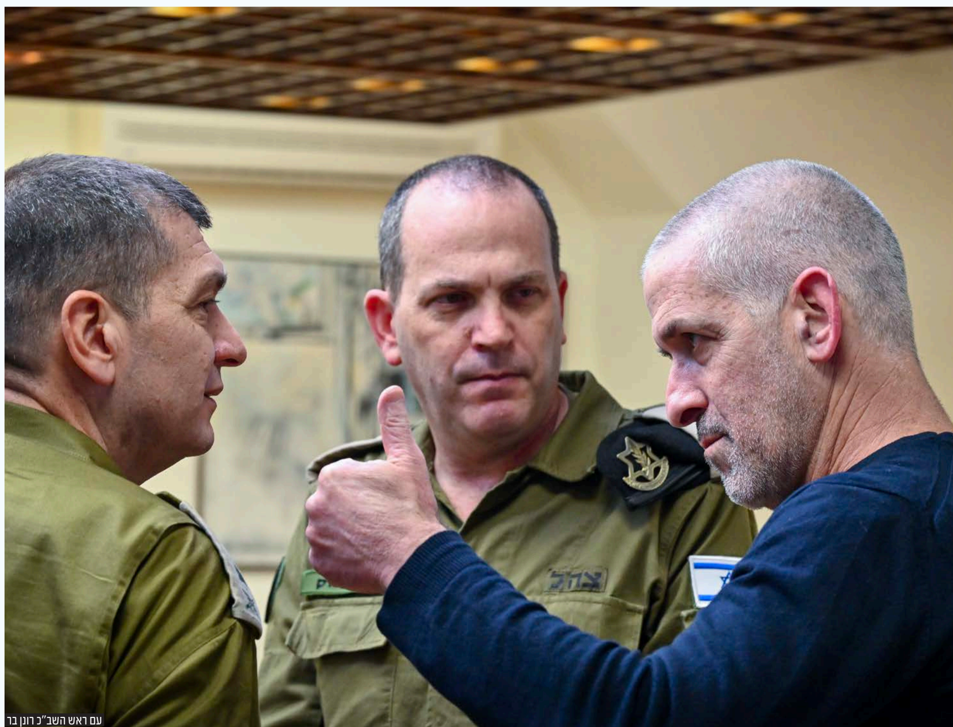
עם ראש השב"כ רונן בר