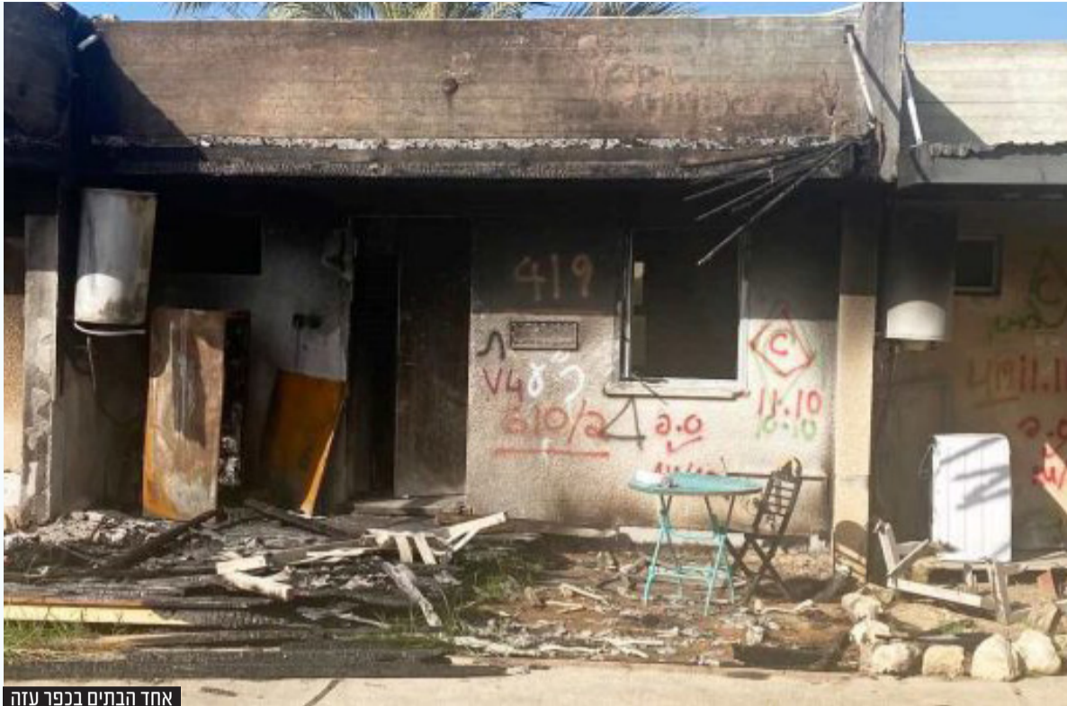
אחד התנים בכפר עזה

לעצמו" כשהוא יוצא ממפגשים אלה על שלא אמר את דעתו. הוא הסביר לי שהרמטכ"ל מפרגן להם במידה רבה כל כך עד שהם לא חשים כלל צורך להשתפר".