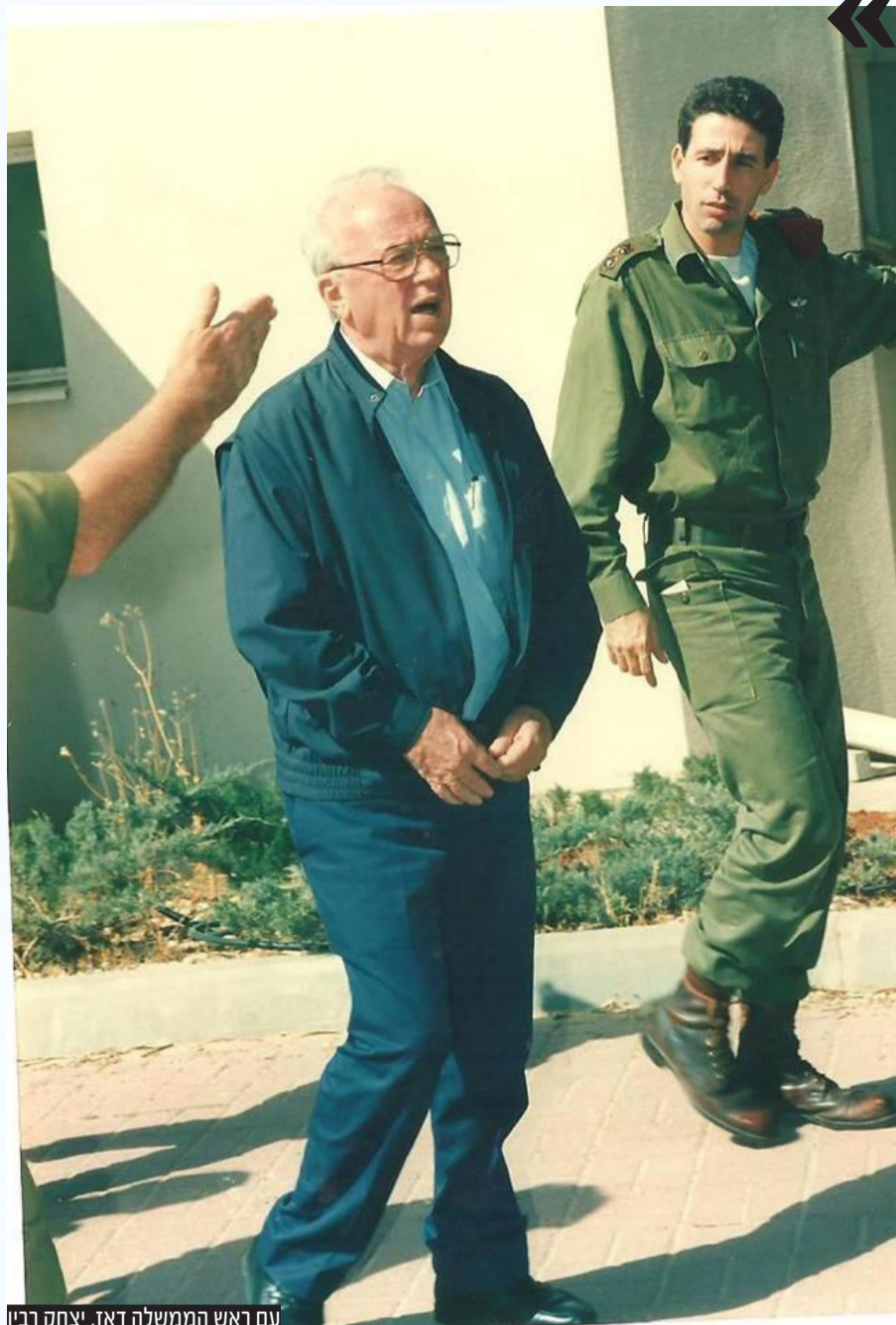
עם ראש הממשלה דאז, יצחק רבין

או פחות מגבול ישראל, והוחזקו על ידי ארגון טרור שבנה מערכת תשתיתית מתוחכמת הכוללת מאות קילומטרים של מנהרות, מערכות הגנה ומגננה. "זו סיטואציה שתיכנס לספרי ההיסטוריה הצבאית", אמר, והוסיף כי האפקט הטראגי של הכוח שבנה חמאס הפך את המשימה למסוכנת ביותר.