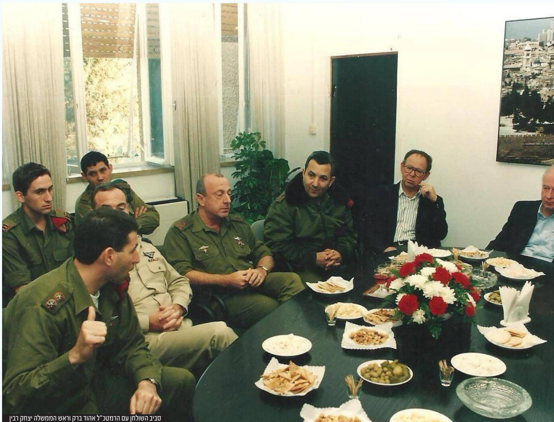
סביב השולחן עם הרמטכ"ל אהוד ברק וראש הממשלה יצחק רבין

מנחם הירשמן צילומים: 'כור ההיתוך', ארכיון לע"מ