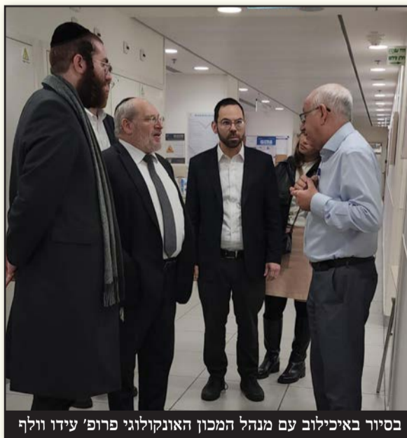
בסיוור באיכילוב עם מנהל המכון האונקולוגי פרופ' עידו וולף