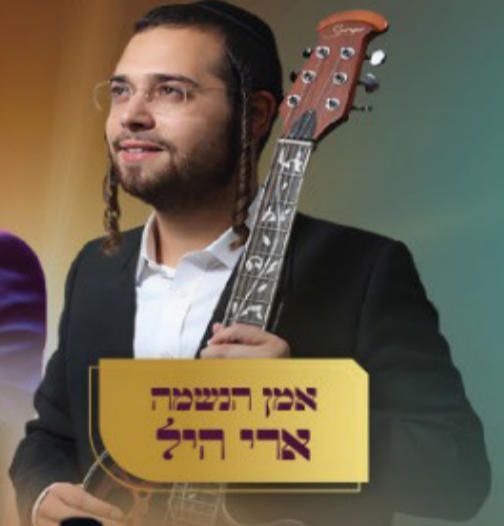
אמן הנשמה ארי הל

שולחן ליל הסדר עם מיטב שירי ההגדה בשירה ותשבחות בשילוב שירת המונים ייחודית!