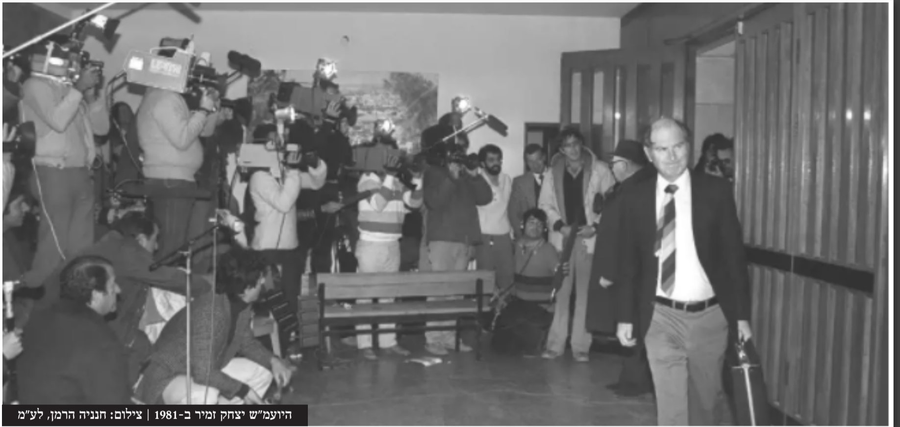
היועץ"ש יצחק זמיר ב-1981

תמים, אלא צעד ראשון בתכנית מבצע שראש שב"כ תכנן כדי למנוע את גילוי האמת, והיא בוצעה על ידי אנשי שב"כ באופן מדויק ויעיל להפליא. לפי התכנית, יוסי גינוסר קיבל על עצמו להיות חבר בוועדה לא כדי לקדם את החקירה אלא כדי לשבש אותה: להרחיק כל חשד שאנשי שב"כ הם שהרגו את המחבלים על פי הוראה של ראש שב"כ. לצורך זה, לאחר יום חקירה בוועדה, גינוסר היה נפגש באופן חשאי בביתו של אחד מאנשי שב"כ עם צוות של אנשי שב"כ, מדווח על העדויות שנשמעו בוועדה, ומשתתף בתדרוך העדים שיופיעו למחרת היום בפני הוועדה למסור עדות שקר. התכנית הצליחה באופן מלא: דוח וועדת זורע ניקה את שר הביטחון מכל אחריות; גם השב"כ יצא נקי מכל חשד; ונותר רק חשוד אחד, תא"ל איציק מרדכי, שנצפה על ידי רבים מכה את המחבלים, אף ששב"כ ידע היטב שלא הוא גרם למות המחבלים.