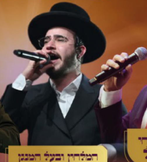
המלחין ובעל המנגן בנצח שמשון