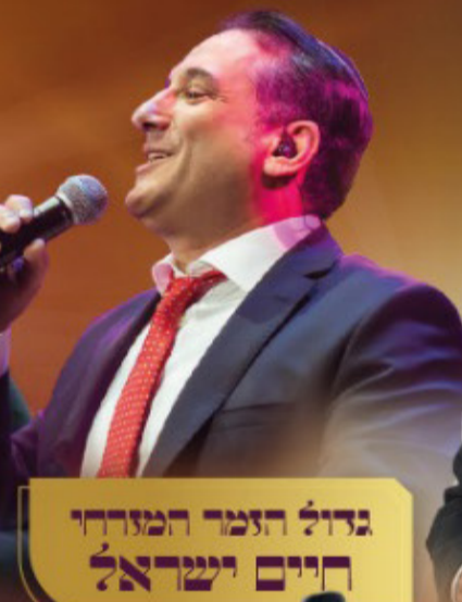
גדול הזמרה המזרחי חיים ישראל