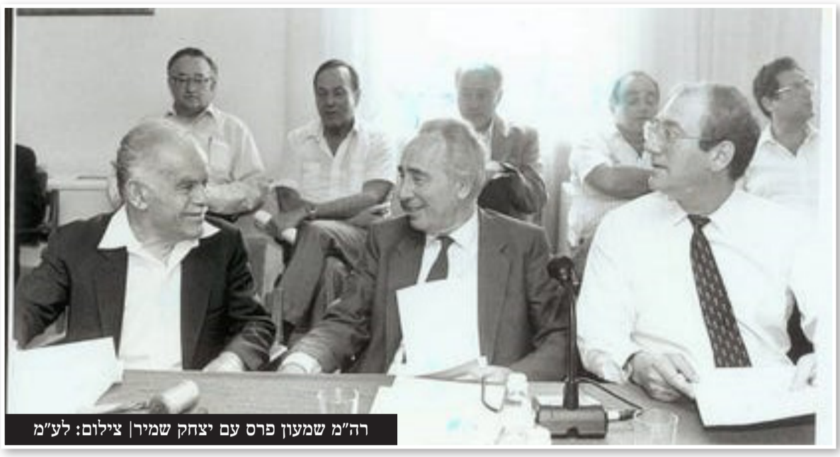
רה"מ שמעון פרס עם יצחק שמיר

בדיונים אלה, כמו בפגישות האישיות עם פרס, הבעתי את דעתי שחומרת העבירות, וכן גם האיום הטמון בהתנהלות שב"כ על יסודות המשטר ועל ערכי היסוד, אינו מאפשר לעצום עיניים ולחזור אל סדר היום כאילו דבר לא אירע. חובה, אמרתי, לקיים חקירה, ואחר כך לשקול מה המסקנה. שאלתי: מה שיקול שיכול להצדיק את סגירת התיק בשלב זה? קיבלתי תשובות אחדות שלא היה בהן ממש, להוציא תשובה אחת: הביטחון. ביטחון המדינה, כך אמרו, מונע קיום חקירה: החקירה תהרוס את שב"כ; היא תעלה בדם חפים מפשע; הם הממונים על הביטחון ולא אני, והם יודעים טוב ממני מה הם צורכי הביטחון, ולכן עלי לקבל את דעתם. השבתי שאכן הביטחון הוא שיקול כבד, אך ביקשתי לדעת מדוע וכיצד קיום חקירה (חשאית) יפגע בביטחון. לא קיבלתי תשובה מניחה את הדעת. לדעתי, אמרתי, נוכח המתרחש בשב"כ עקב הפרשה, ביטחון המדינה מחייב חקירה, ודווקא אם המצב יישאר כפי שהוא, התפקוד של שב"כ יתערער ויסכן את הביטחון. התוצאה