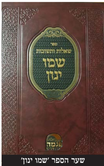
שער הספר 'שמו ינון'

האם המחלוקת המפורסמת בין שני ראשונים לציין באה לסיימה? פסיקה מנומקת של הגר"י רביב בספר חדש מציגה טעם נוסף להיתר השימוש בכמון בפסח