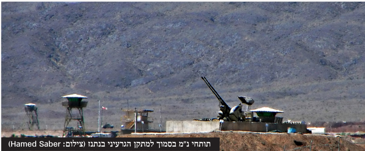
תוחי נ"מ בסמוך למתקן הגרעיני בנתנו

סגן שר החוץ האיראני, עבאס עראקצי אמר כי טהראן דבקה בעמדתה שלא לקיים משא ומתן ישיר עם ארצות הברית כל עוד נמשכת מדיניות הלחץ כלפיה. יחד עם זאת, הדגיש סגן שר החוץ האיראני כי איראן פתוחה לניהול