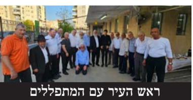
ראש העיר עם המתפללים

במסגרת העבודות היסודיות זכתה חצר בית הכנסת לריצוף חדש ונבנתה גדר היקפית