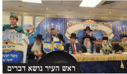
ראש העיר נושא דברים