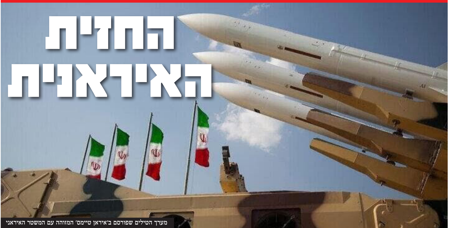
מערך הטילים שפורסם ב'איראן טיימס' המזוהה עם המשטר האיראני

בראיון ל-NBC איים נשיא ארה"ב דונלד טראמפ על הממשל בטהרן: "אם הם לא יגיעו לעסקה, יהיו הפצצות - מהסוג שהם מעולם לא חוו בעבר" • בכיר בצבא איראן לטלגרף הבריטי: "אם ארה"ב תתקוף את איראן מהבסיס האסטרטגי באי דייגו גרסיה באוקיינוס ההודי - איראן תתקוף את הבסיס ישירות"