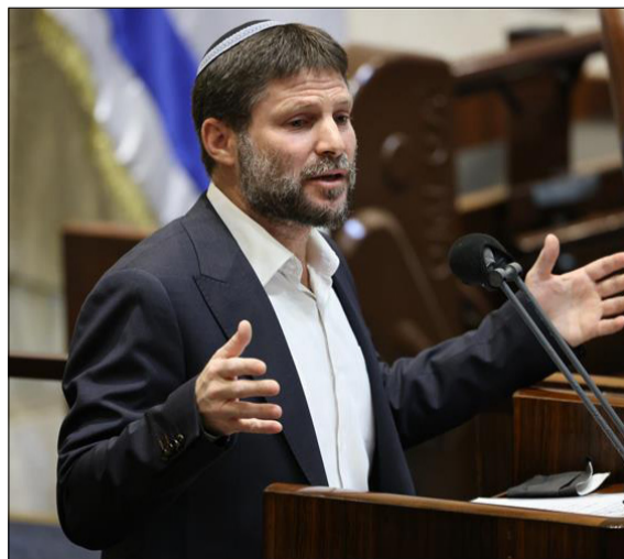
« חמישה תקציבים בשנתיים. שר האוצר בצלאל סמוטריץ'

מרן, שלאורך חצי השנה האחרונה הכתיב את הקו המתון והסובלני, בכל הנוגע לחוק הגיוס ובכלל, התבטא באופן חריג והתייחס להפרות החוזרות ונשנות של ההבטחות. "אנחנו במצב שכבר כמעט אי אפשר לסמוך על איש, וודאי לא על גורמים בשלטונות, וכל מיני הבטחות שניתנו מופרות פעם אחר פעם, ואנו אין לנו שיוזר אלא התורה הזאת ואין לנו להישען אלא על אבינו שבשמים"