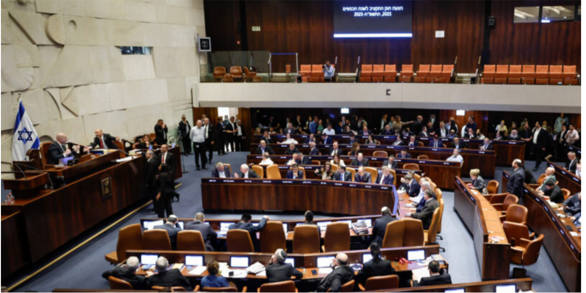
סוף הדומה. העברת התקציב במליאת הכנסת

בחזרה, אבל ההטבות שנרשמו עבור השוטרים בתקציב הנוכחי, יופיעו רשמית על שמו של השר המחליף חיים כץ, שספק אם דרך במשרדו. בזמן שמי שניהל את המאבק העיקש עבורם היה איתמר בן גביר, היה סמוטריץ' זה שצחק אחרון, כל הדרך לניסוח מכתב ההתפטרות הזמני שנועד להשיב אותו לכנסת במסגרת החוק הנורבגי ולאזן מחדש את היחס הפנים מפלגתי בין השניים. לפעמים הכול עניין של טיימינג.