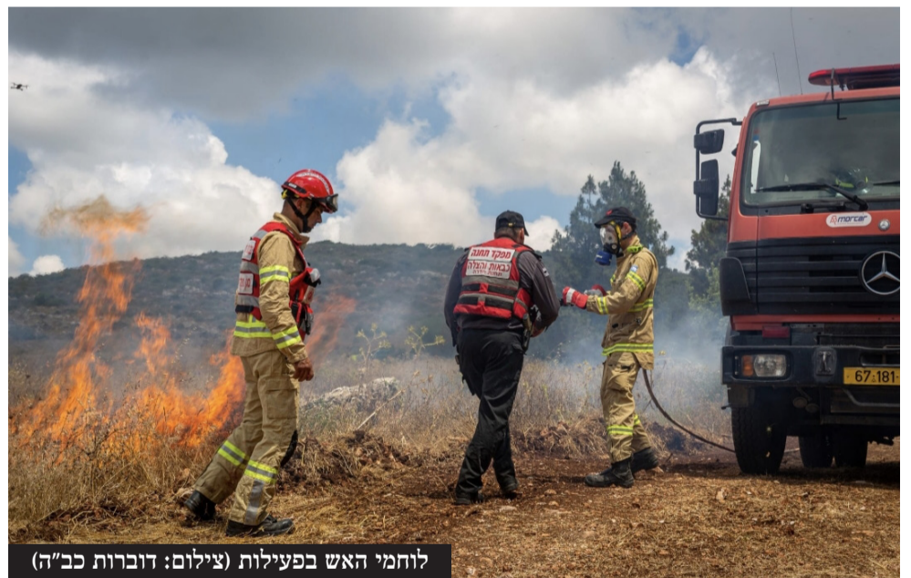
לוחמי האש בפעילות