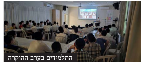
התלמידים בערב ההוקרה