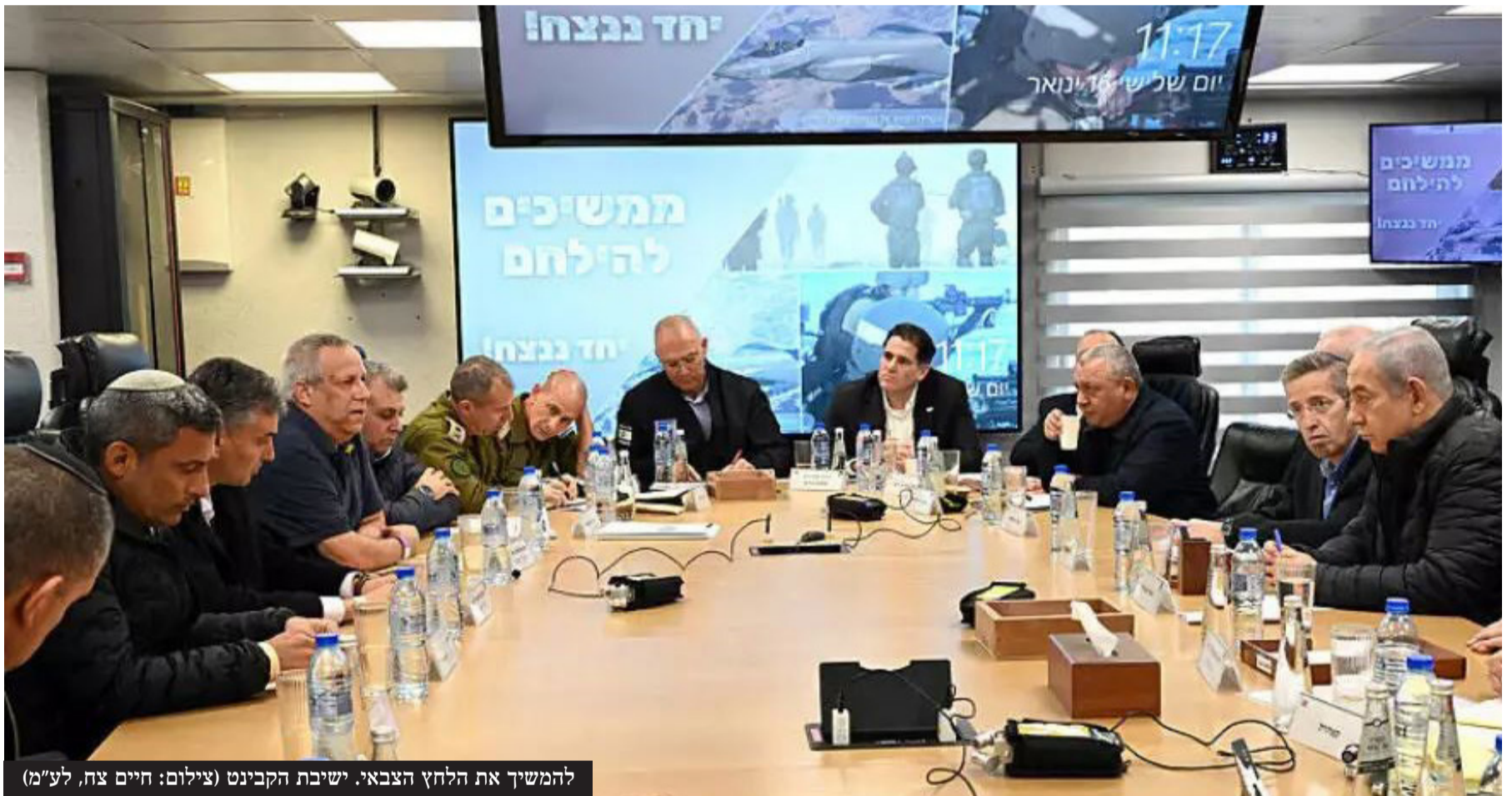
להמשיך את הלחץ הצבאי. ישיבת הקבינט

באשר לטענה שישראל מסרבת לדון בשלב הסופי, נתניהו הכחיש בישיבת הממשלה ואמר: "גם זה לא נכון. אנחנו מוכנים לדון. חמאס יניח את נשקו, מנהיגיו ייצאו, אנחנו נדאג לביטחון ברצועה ונקדם את תוכנית טראמפ - תוכנית ההגירה מרצון. זו התוכנית ואנחנו לא מסתירים אותה"