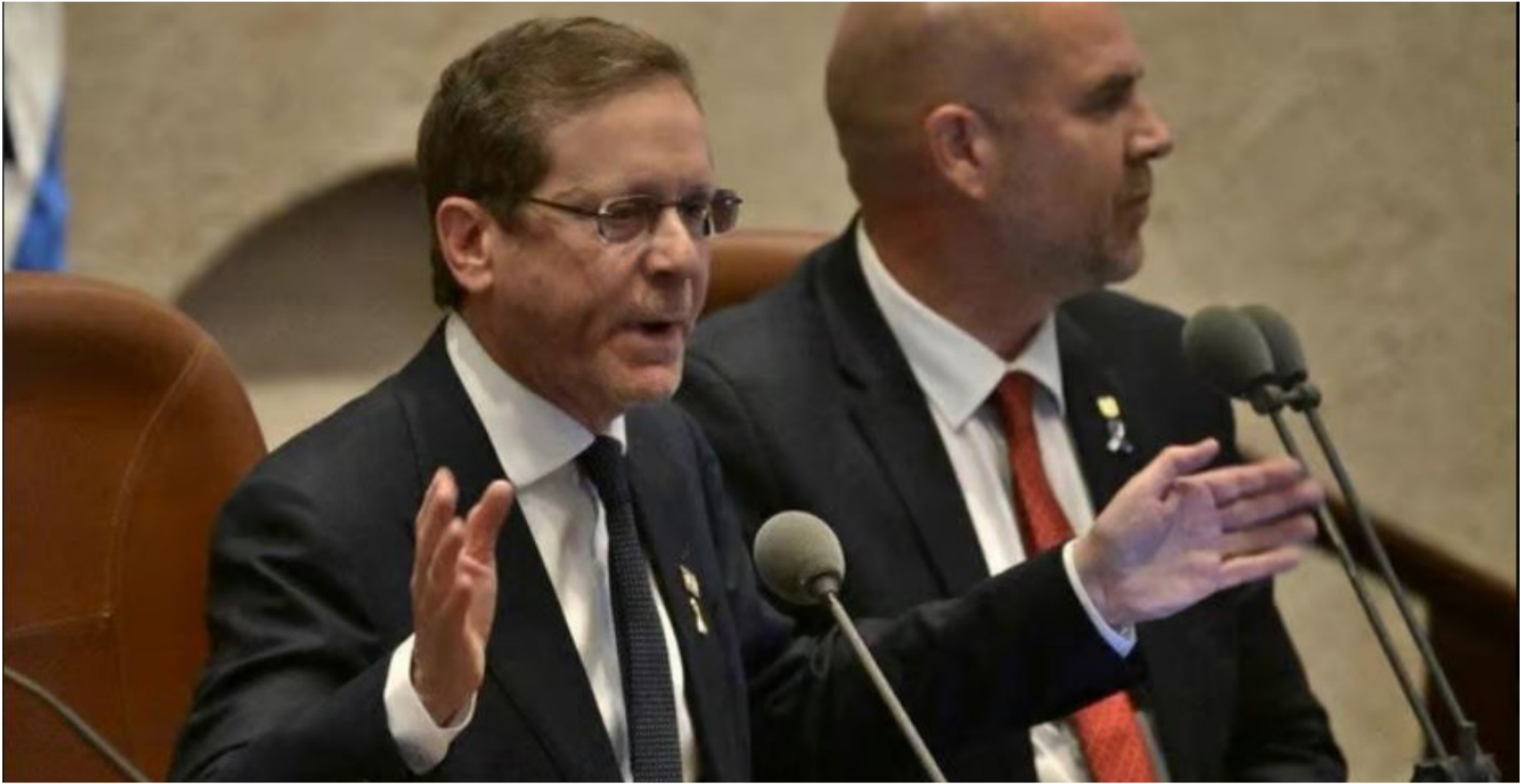
נאום 'ספונטני' ומתוכנן היטב. נשיא המדינה בוז' הרצוג