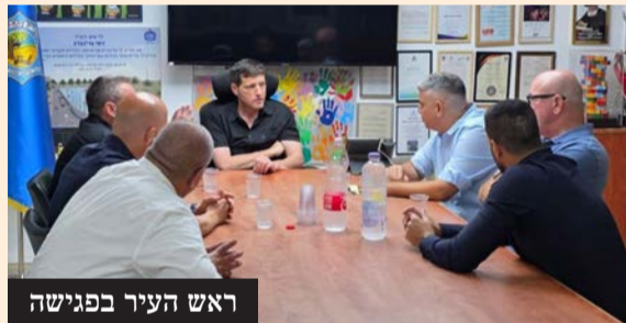
ראש העיר בפגישה