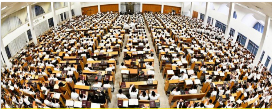
ישיבת חברון: ירידה מ-9 מיליון ש"ח ל-800 אלף ש"ח