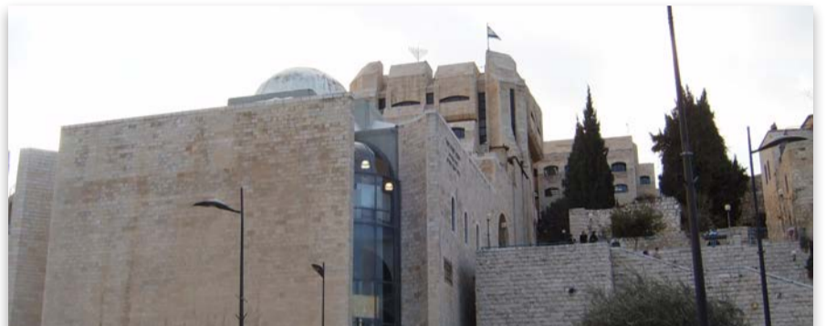
ישיבת פורת יוסף: ירידה מ-1.9 מיליון ש"ח ל-240 אלף