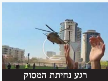
רגע נחיתת המסוק