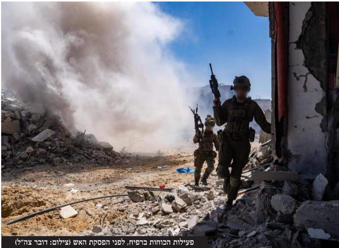
פעילות הכוחות ברפיח, לפני הפסקת האש