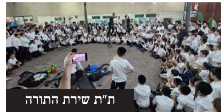
ת"ת שירת התורה