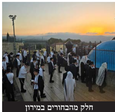
חלק מהבחורים במירון

אביו של אחד המשתתפים שיתף: "המסע הזה הוא בדיוק מה שהבחורים שלנו צריכים בימים אלו"