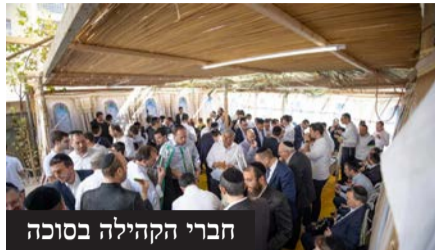
חברי הקהילה בסוכה