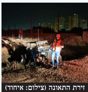
זירת התאונה

גבר כבן 62 אותר ללא רוח חיים בביתו ברחוב סוקולוב בפתח תקווה בשבוע שעבר. מתנדבי זק"א מרחב שרון הגיעו לזירה לטיפול בכבוד המת. בזכות פעילותם המסורה, שוחררה גופת הנפטר לקבורה עוד הערב, ובכך נמנע עיכוב כואב במסע הלוויה.