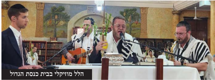
הלל מוזיקלי בבית כנסת הגדול

עיריית פתח תקווה, באמצעות היחידה לתרבות חרדית, מסכמת בסיפוק רב את אירועי חול המועד סוכות, שהתקיימו בהשתתפות אלפים מתושבי העיר