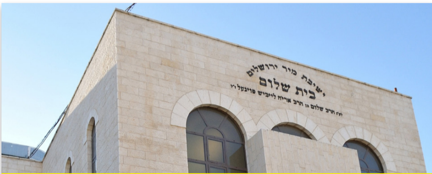
ישיבת מיר: ירידה מ-56 מיליון ש"ח ל-29 מיליון