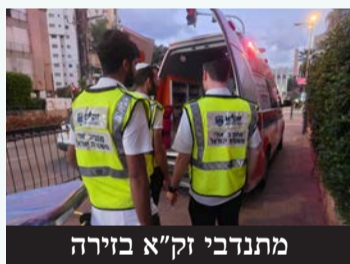
מתנדבי זק"א בזירה