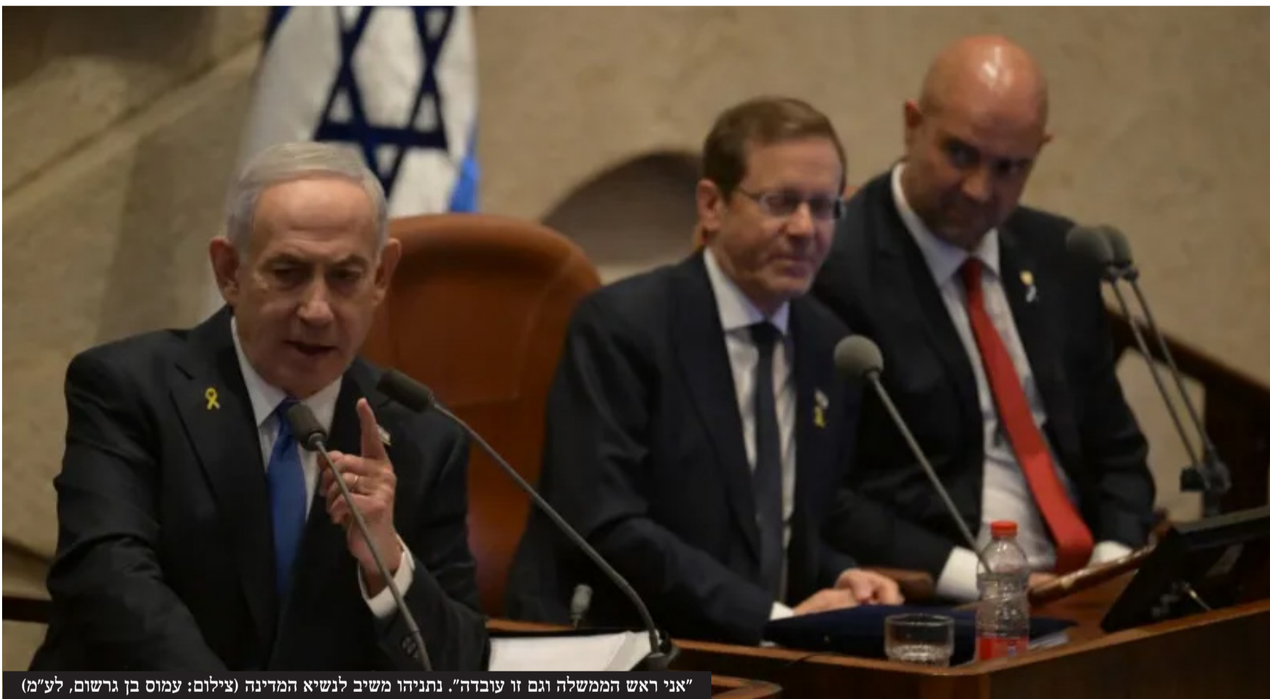
"אני ראש הממשלה וגם זו עובדה". נתניהו משיב לנשיא המדינה

יום סוער עם פתיחת מושב החורף: יו"ר הכנסת אמיר אוחנה סירב לכנות את יצחק עמית בתואר נשיא ביהמ"ש העליון, נשיא המדינה יצחק הרצוג זנח את הנאום שהכין וסנט ביו"ר הכנסת ונציגיה, יו"ר האופוזיציה התעקש לכנות את אוחנה יו"ר חצי כנסת, ונתניהו השיב לנשיא המדינה: עמית הוא נשיא ביהמ"ש העליון אבל שוכחים שאני ראש הממשלה ואלה הם שרי הממשלה