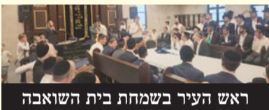
ראש העיר בשמחת בית השואבה