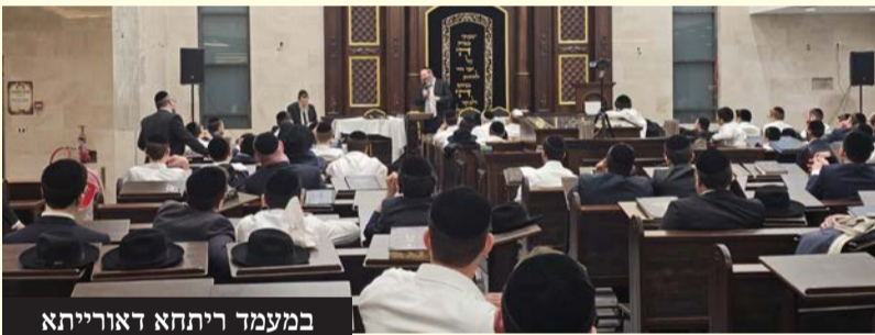
במעמד ריתחא דאורייתא

רבים מטובי תלמידי החכמים ובני התורה נהרו לביהמ"ד שגשש ורעש בריתחא של תורה