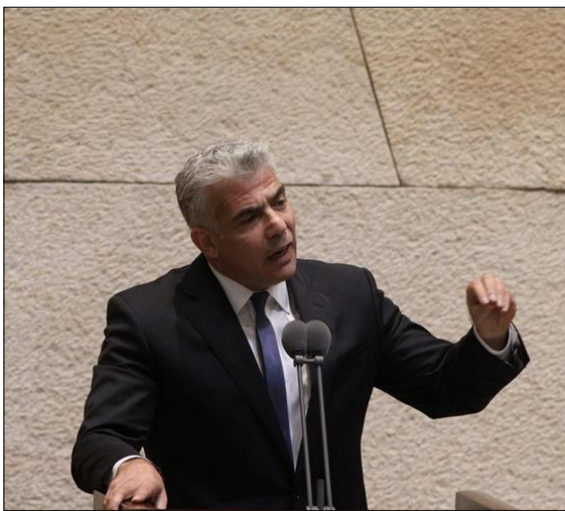
« לא מעוניין בבחירות. יו"ר יש עתיד ח"כ יאיר לפיד

הרצוג אולי מזהה את הואקום העצום בהנהגת מחנה המרכז-שמאל, ולא מן הנמנע שהוא מתחיל לתכנן את היום שאחרי משכן הנשיא, כמנהיג שיושיע את המחנה האבוד, וכמי שהיה אחד האחרונים לתת פייט יחסי לנתניהו כשעמד בראשות מפלגת העבודה בעשור הקודם וגם מביא אתו רוזמה מכובד שעשוי לגרוף קולות משלל קהלים