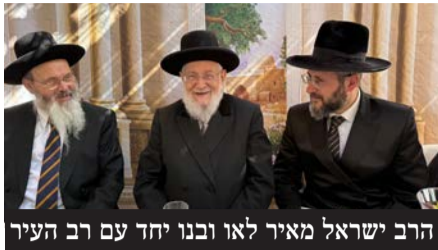
הרב ישראל מאיר לאו ובנו יחד עם רב העיר

במהלך ימי החג התקיימו במקום שמחת בית השואבה והקפות שניות ברוב עם