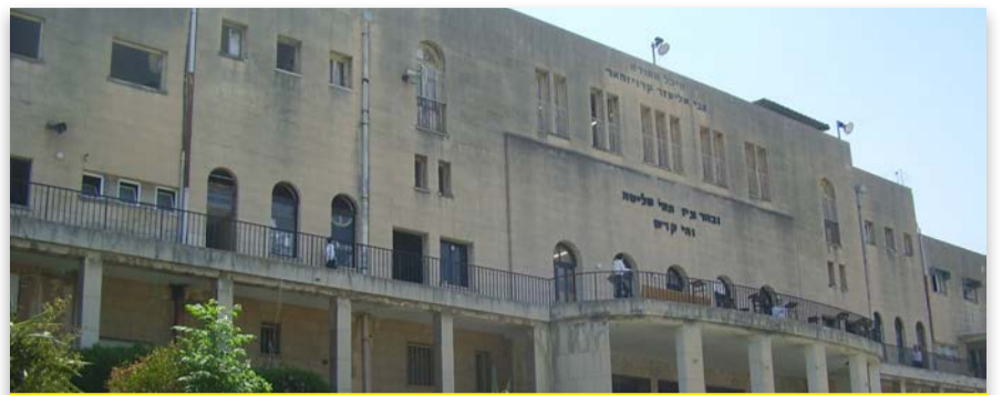
ישיבת פוניבז': ירידה מ-22 מיליון ש"ח ל-7 מיליון