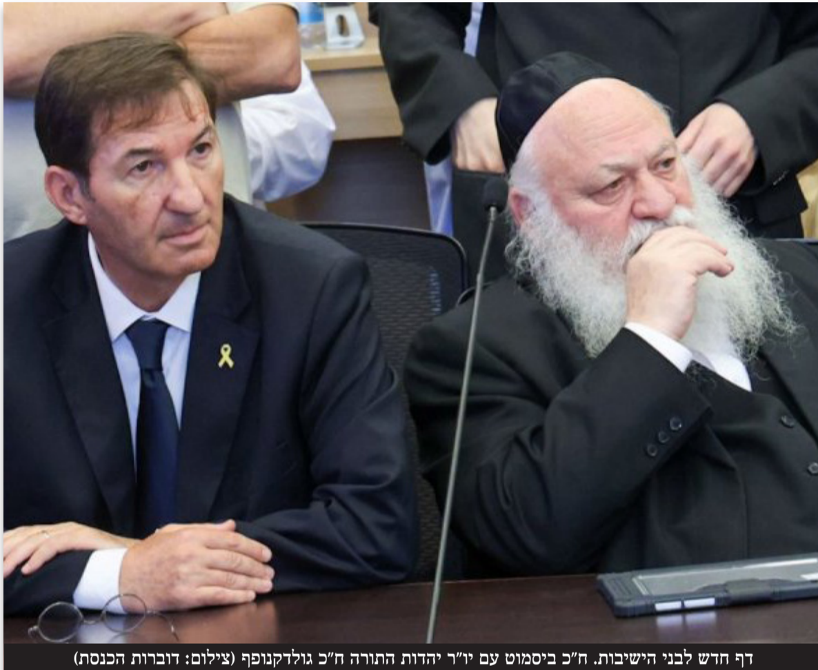
דף חדש לבני הישיבות. ח"כ ביסמוט עם יו"ר יהדות התורה ח"כ גולדקנופף

מושב החורף של הכנסת נפתח בשבוע האחרון וסוגיית הסדרת מעמדם של תלמידי הישיבות שוב עולה על סדר היום ומאיימת על שלימות הממשלה בתקופה מאתגרת. בעוד שבמפלגות החרדיות, יש מי שמחפשים פתח שדרכו יוכלו לשוב לממשלה, יו"ר ועדת החוץ והביטחון ח"כ בועז ביסמוט צפוי בקרוב להציג את הנוסח שלו לחוק הגיוס, שלמעשה יסדיר את מעמד בני הישיבות.