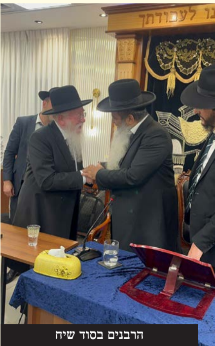
הרבנים בסוד שיח

ועשירה, כאשר מאות המשתתפים פצחו בריקודים סוערים לכבודה של תורה, מתוך תחושת אחדות עמוקה והודיה לה' יתברך על הזכות לראות את בניו שבים לחיק אביהם שבשמיים.