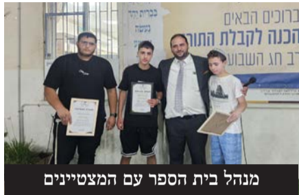
מנהל בית הספר עם המצטיינים

התקופה האחרונה. לקול תשואות הקהל, נשאו התלמידים את נאומו הסיום, כאשר דמעות של שמחה וגאווה נקוו בעיני ההורים הנרגשים לנוכח ההישג התורני הכביר של בניהם. מיד לאחר מכן, נעמדו מאות הנוכחים יחד לתפילת השל"ה הקדוש מעומק הלב, ולאחריה נהנו מסעודת בשרים חגיגית.