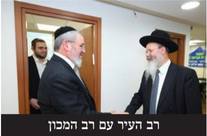
רב העיר עם רב המכון

דרמטית גם על תלמידים המתמודדים עם בעיות רגשיות או נפשיות. כאשר תלמיד חווה הצלחה והבנה קוגניטיבית, הדבר תורם ישירות לביטחון העצמי שלו ומעניק לו את הכוח להתמודד עם משבריו האחרים.