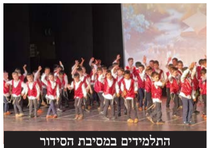
התלמידים במסיבת הסידור