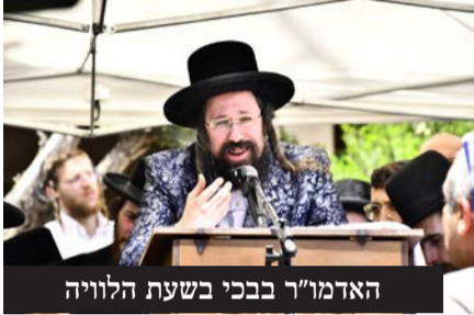
האדמו"ר בכבי בשעת הלוויה