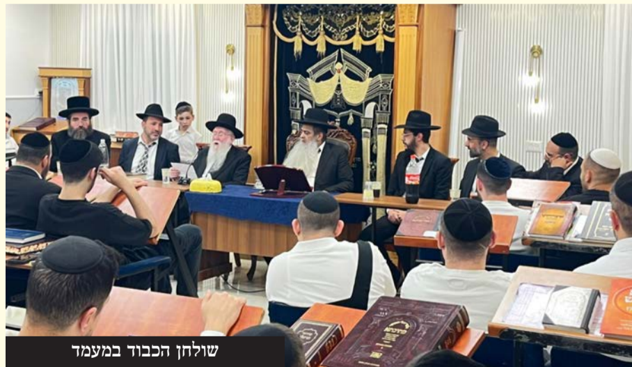
שולחן הכבוד במעמד

ועשירה, כאשר מאות המשתתפים פצחו בריקודים סוערים לכבודה של תורה, מתוך תחושת אחדות עמוקה והודיה לה' יתברך על הזכות לראות את בניו שבים לחיק אביהם שבשמיים.