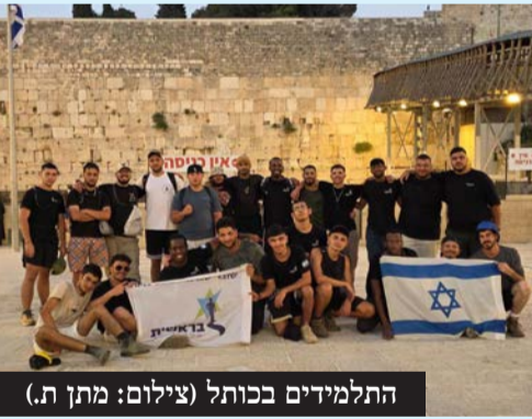
התלמידים בכותל

חניכי המכינה הקדם-צבאית ציינו את יום ירושלים במסע רגלי בן יומיים עד לכותל המערבי • התוכנית שילבה בין גילוי חוזקות אישיות לערבות הדדית וחיבור למדינה