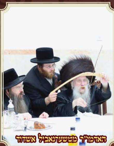
האדמו"ר ממשעתנאביל אשהוד