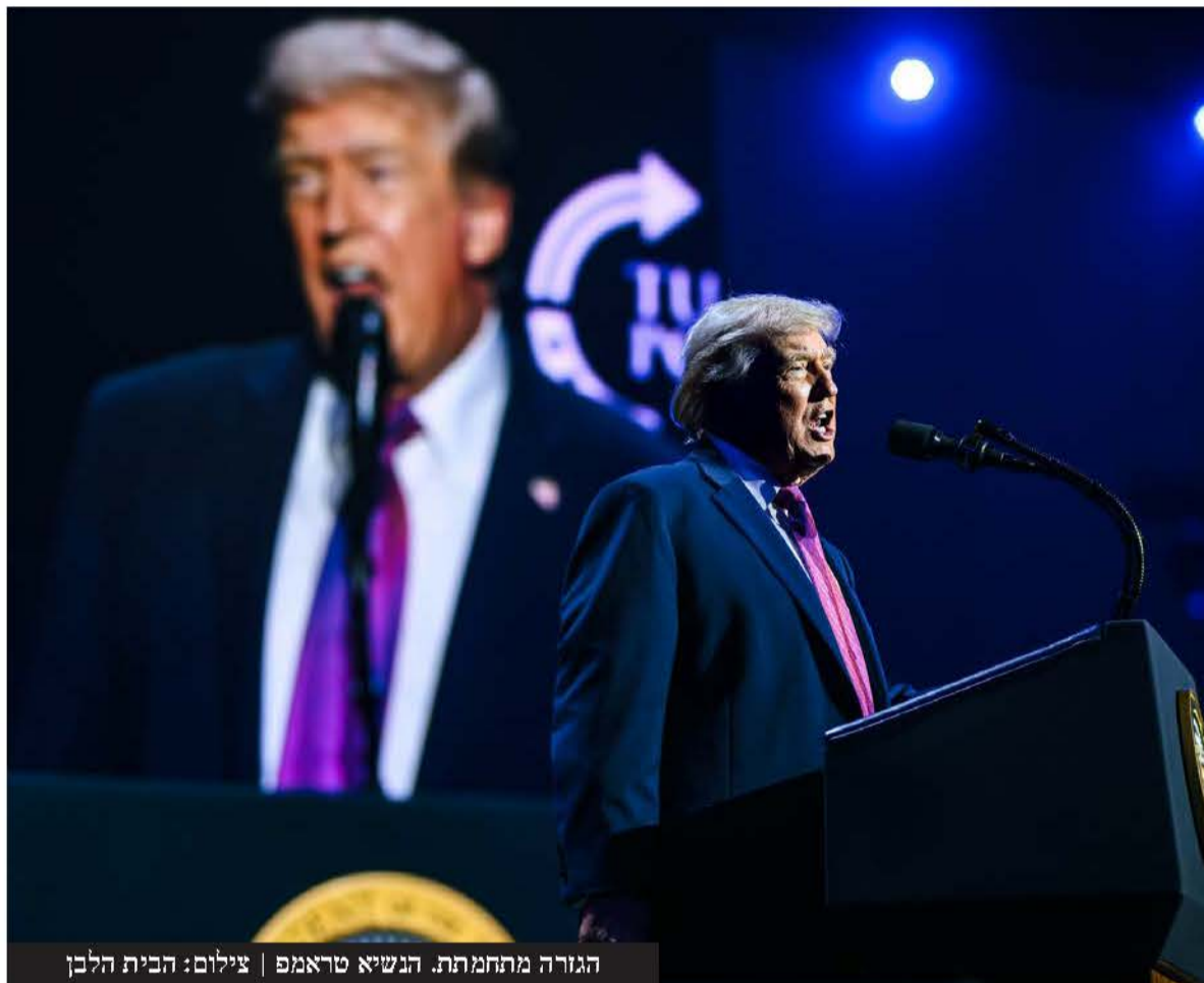
הגורה מתחמת. הנשיא טראמפ

נשיא ארה"ב דונלד טראמפ, הכריז על מבצע צבאי-הומניטרי רחב היקף שמטרתו לשבור את המצור הימי ועורר זעם כבד באיראן שבחרה לתקוף את מדינות המפרץ • המתיחות בנתיב השיט הקריטי ביותר של תעשיית הנפט העולמית נותרת בשיאה