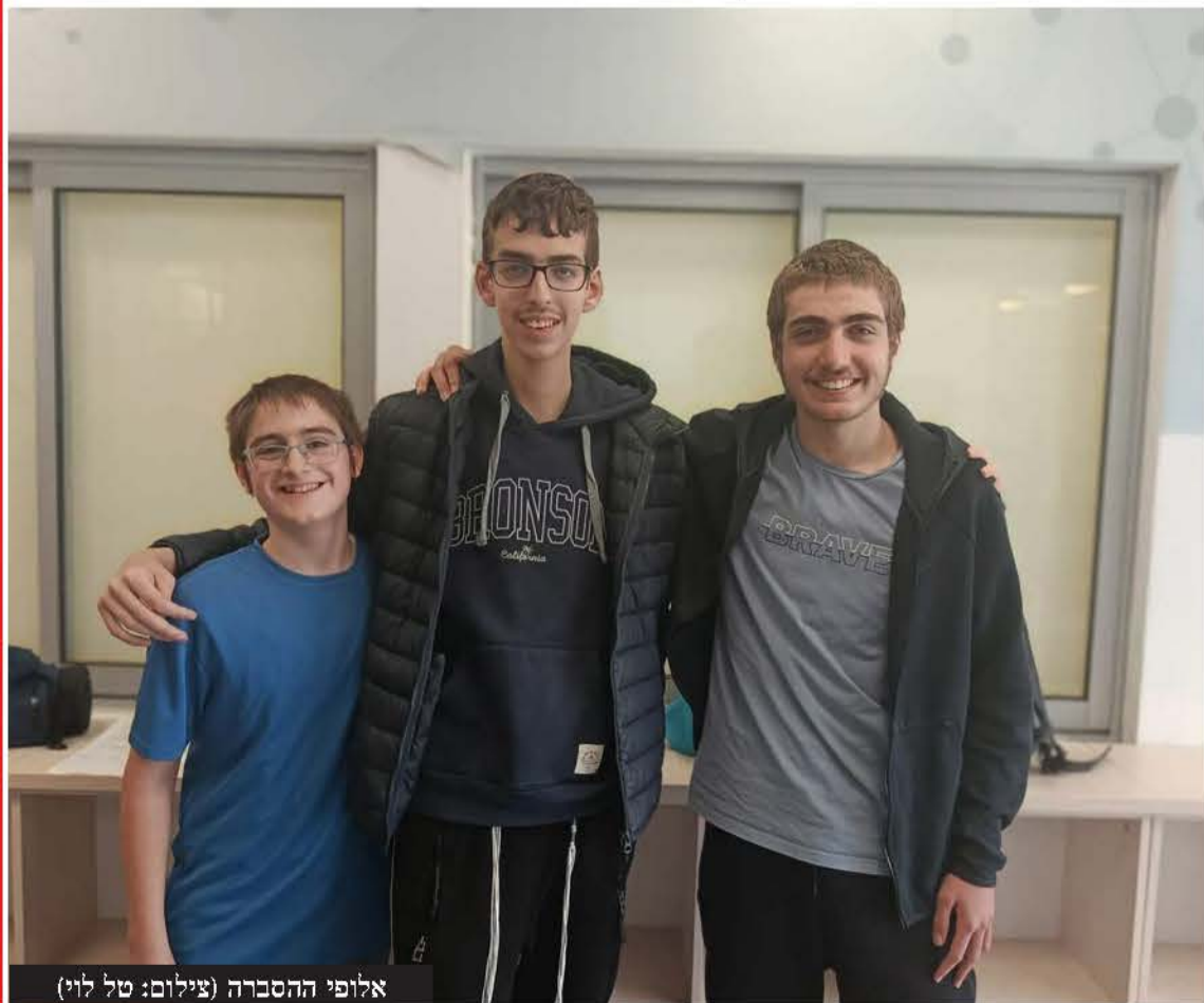
אלופי ההסברה

תלמידי בית החינוך, קטפו את המקום הראשון בתחרות "שגרירים צעירים" שנה שנייה ברציפות • המנצח: קומיקס מרגש המגולל את סיפורו של גיא גלבווע דלל שנחטף מ"הנובה"