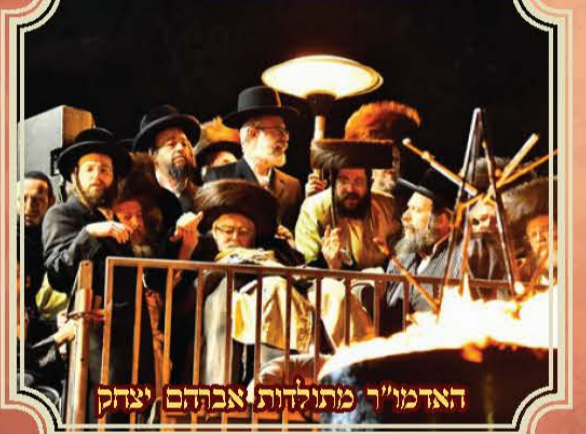
האדמו"ר מתולדות אברהם יצחק