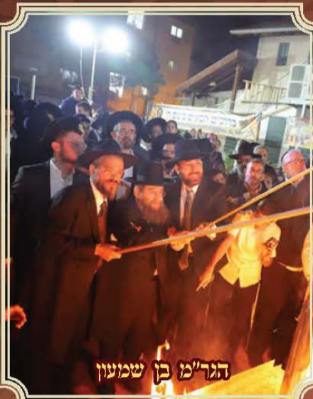
הגר"מ בן שמוען