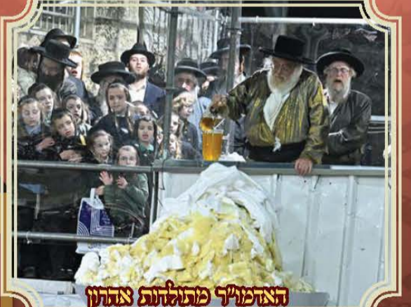
האדמו"ר פועלטהו צהרן