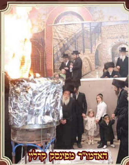
האדמו"ר מפנסק קרלין