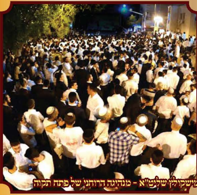
אלפים בהדלקת ל"ג בעומר אצל כ"ק מורן אדמו"ר ממישקולין שליט"א - מנהגה הרוחני של פתח תקוה