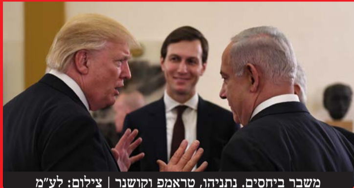
משבר ביחסים. נתניהו, טראמפ וקושנר

משבר עמוק: נשיא ארה"ב אמר כי על נתניהו "להיות אחראי יותר", כינה את התקיפה בביירות "אכזרית ולא מידתית" וטוען - "בלעדיי ישראל לא הייתה קיימת". על איראן: "המנהיגים החדשים רציונלים, נעים לעבוד איתם". מיוחד ל'קו עיתונות': פרופ' אייל זיסר מנתח את ההשלכות החמורות של העסקה המסוכנת שנרקמת בין ארה"ב למשטר האיראני ומפקירה את ישראל | עמ' 12-13