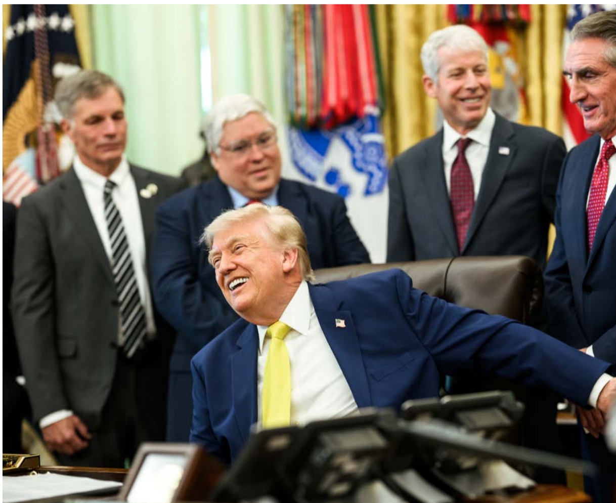
פרופ' אייל זיסר

ארה"ב חתכה הפסדים מול איראן, הותירה אותנו עם משטר משתקם, ובזירה הלבנונית נאלצנו לקבל תכתיבים משפילים • ישראל חייבת להפסיק להתנהג כ"שכירת חרב" וליצור, סוף כל סוף, אסטרטגיה עצמאית • מיוחד ל'קו עיתונות': פרופ' אייל זיסר מנתח את ההשלכות החמורות של העסקה המסוכנת שנוקמה בין ארה"ב למשטר האיראני ומפקירה את ישראל